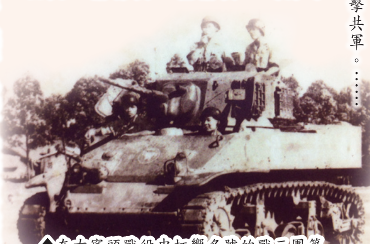
在古寧頭戰役中打響名號的三團第三十六號M5A1戰車。

地區，為我十八軍警衛營發現，率部出擊。此時共軍已佔領古寧頭及一點紅等高地。 十月二十五日天亮後，我軍戰車在空軍戰機掩護下，集中火力攻擊共軍。前一天在古寧頭地區演習的戰車連，有輛故障戰車停於原地，發砲射擊，強攻被我軍圍困之共軍，並