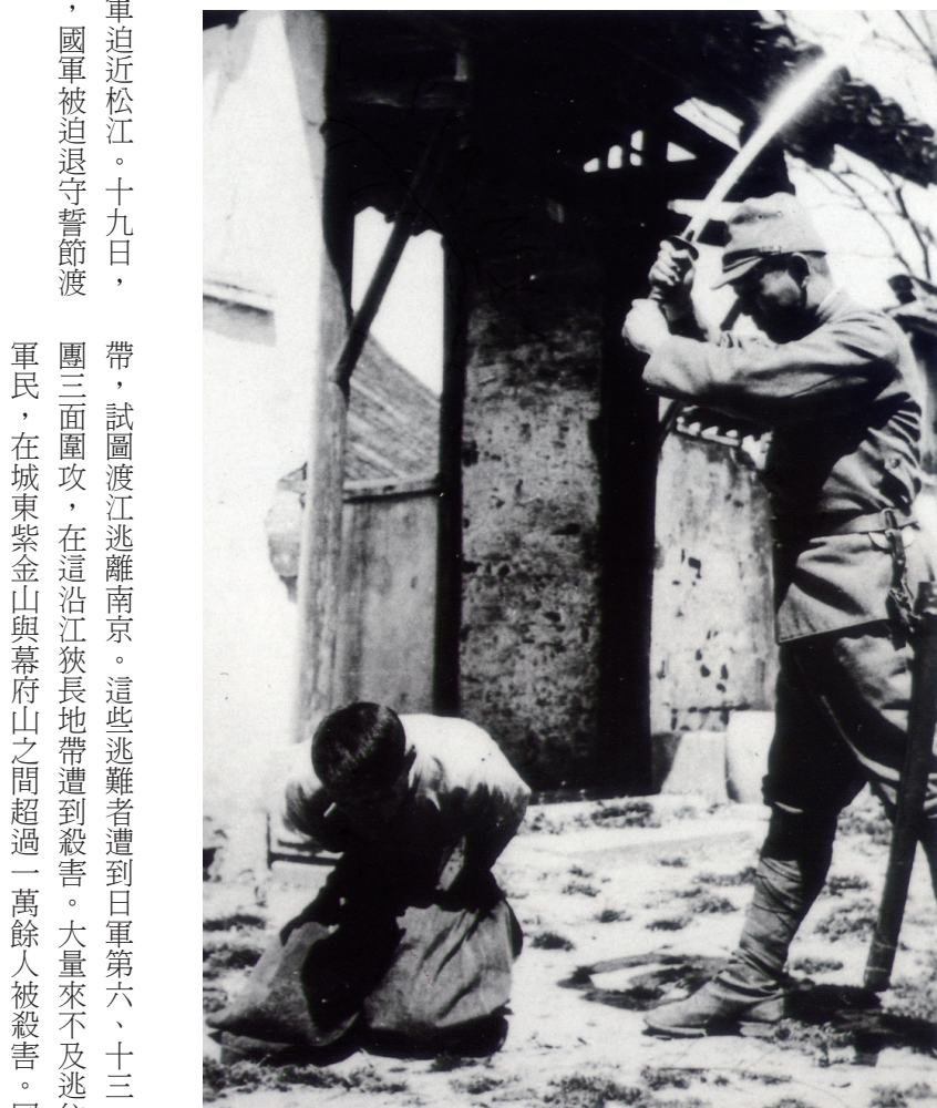
日軍以斬首的殘忍手段，殺害我無辜同胞。

民國二十六年八月十三日，日軍意圖侵入我上海虹橋機場，引發爭端。市區日租界內的日軍隊開始突擊我部隊，國軍予以反擊，「淞滬會戰」爆發。這時，鑑於日軍裝備優良，不利於國軍的陣地作戰，於是擬定一長期作戰方略，利用廣大空間土地，換取時間上持久之勝利，不重一城一地之得失，而以積小勝成大局。