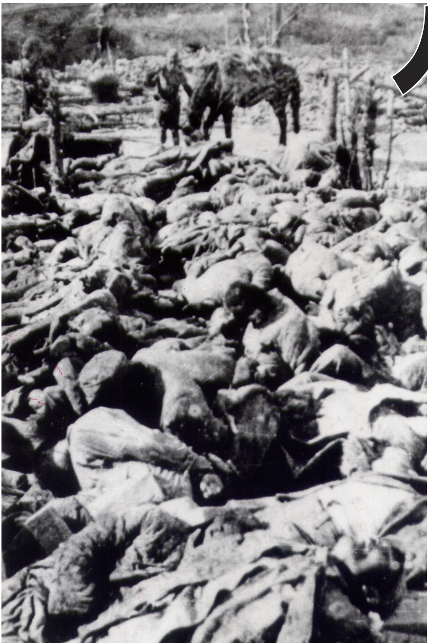
遭日軍瘋狂屠殺的我軍民同胞屍橫遍野。

帶，試圖渡江逃離南京。這些逃難者遭到日軍第六、十三、十六師團三面圍攻，在這沿江狹長地帶遭到殺害。大量來不及逃往下關的軍民，在城東紫金山與幕府山之間超過一萬餘人被殺害。同一天，日本海軍也以艦上槍砲連續射擊，殺害了一萬餘江上漂流的中國軍民。 至於個人的屠殺行為，更是罄竹難書，日軍第十六師團少尉軍官向井敏明和田田毅，彼此比賽先殺滿一百人為勝，每人均殺害無辜中國人達二百人以上，並被稱為「皇軍的英雄」。根據二戰後南京軍事法庭查證，日軍在南京的「集體屠殺」共有二十八案，計十九萬餘人受害。