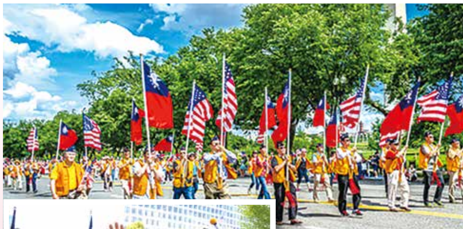
▲整齊壯觀的中美國旗隊伍，遊行通過華府地標華盛頓紀念碑。

中華民國無論是在二戰或是越戰，始終都是美國的堅定盟友，遊行活動主辦單位特別邀請代表我國退伍軍人的華府榮光聯誼會參與；儘管許多榮光會員及眷屬已年屆古稀，但想到能讓中華民國國旗在美國街頭飄揚，仍全力以赴。