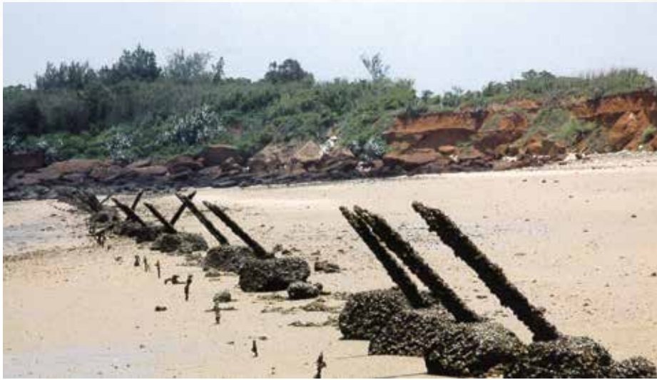
▲最後殘留的共軍在北山斷崖這處海灘被俘。