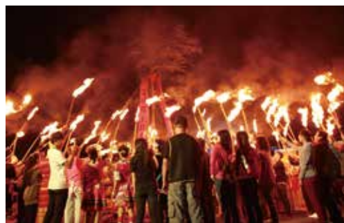
▲「清境火把節」現場熱鬧滾滾。

輔導會所屬的清境農場鄰近日月潭，也是不能錯過的好去處。10月27、28日晚上7點在清境國小還有「清境火把節」，活動內容包括清境擺夷舞蹈表演、火把迎賓、賽德克原住民舞蹈等，歡迎民眾參加。