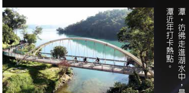
▲向山自行車道上的同心橋，象徵情人永結同心，攜手共度一生。