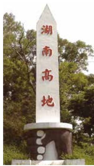
▲湖南高地紀念碑。