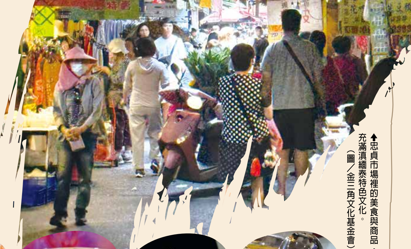
↑忠貞市場裡的美食與商品，充滿滇緬泰特色文化。

比起逛百貨公司，旅遊時逛逛有「味道」的傳統市場，更接地气，也更感受一個城市的活力。尤其是鄰近眷村的老市場，攤商與顧客南腔北調，販售的貨物五花八門，每每在市場一角，隱藏著來自各省的特色美食與珍寶，等待你去探索，讓旅程充滿驚喜。