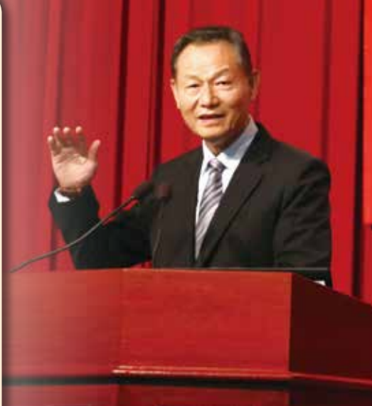
李主委在輔導會4月份會中，要求同仁拋開本位主義，加強單位橫向聯繫與團隊合作。

【本刊訊】輔導會日前召開四月份會，主委李翔宙致詞時表示，希望同仁拋開本位主義，加強單位橫向聯繫與團隊合作，不只是把事情做完，更要做好、做到位，提高輔導會的價值地位，成為讓人引以為傲、不容忽視的團隊。