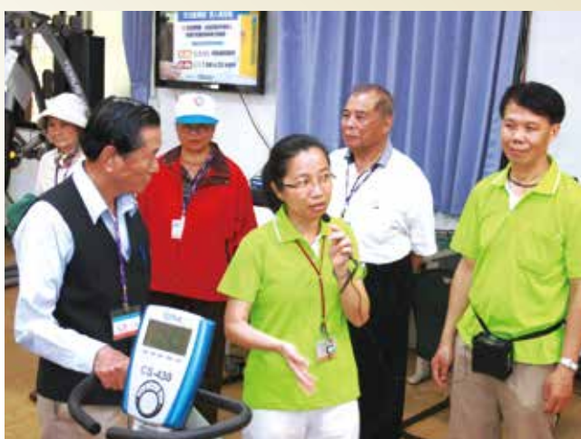
臺中市退休公教人員協會參訪中彰榮家復健室，稱讚設施完善。