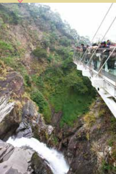
小烏來天空步道能親近涼涼瀑布，是桃園避暑勝地。