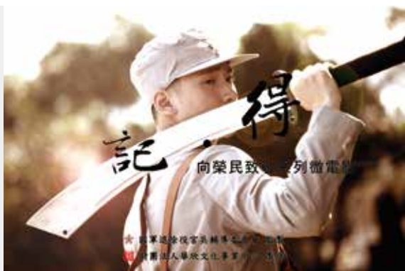
輔導會製作的微電影「記得」感動人心。（圖片提供／輔導會）

【本刊訊】輔導會五月三日發行微電影——「記得」，藉由描述一對年輕男女朋友回憶曾是「大刀隊」成員的榮民爺爺的生命故事，闡述「大刀隊」的血淚史。「大刀隊」是抗日戰爭時期由第二十九軍編成，由於使用的武器和敵軍極不對等，仍能以弱擊強，誓死抗敵，犧牲報國的動員長留青史，永烙人心。 他們在褪下軍服後，仍參與國家重大軍建設，奉獻一生青春和血汗，建設臺灣；輔導會製作微電影——「記得」，就是把先輩榮民可歌可泣的事蹟，串連製作成完整的光輝歷史，呈現給國人。 微電影——「記得」露出的平臺有：輔導會及所屬機構官網、FB、YouTube等影音網，歡迎全國榮民、榮眷及國人踴躍觀賞、流傳。