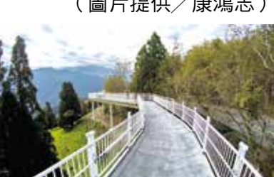
清境高空步道穿梭樹叢，展現豐富生態景觀。