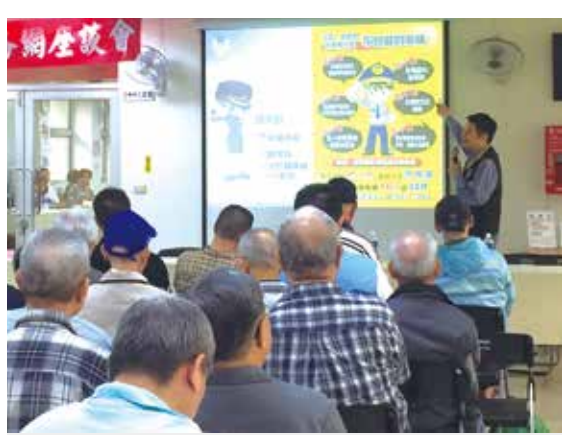
新北市警察局員警出席新北市榮服處服務網座談會，宣導防止詐騙技巧。

輔導會主委李翔宙表示，輔導會長期深耕經營，榮民早已將榮服處員工與志工當成是唯信賴的家人，面對詐騙案件，最後仍選擇相信榮服處，不僅印證輔導會服務照顧的成果，