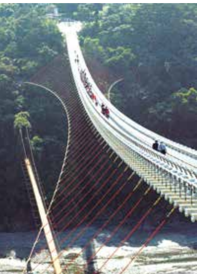
山川琉璃吊橋是屏北地區著名旅遊景點。