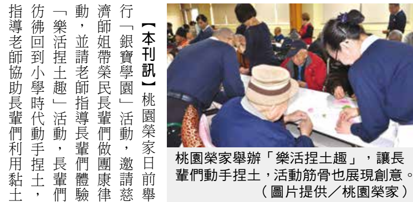
桃園榮家舉辦「樂活捏土趣」，讓長輩們動手捏土，活動筋骨也展現創意。

【本刊訊】桃園榮家日前舉行「銀寶學園」活動，邀請慈濟師姐帶榮民長輩們做團體律動，並請老師指導長輩們體驗「樂活捏土趣」活動，長輩們彷彿回到小學時代動手捏土，指導老師協助長輩們利用黏土捏成多個玫瑰，裝飾在心型相框上，伯伯們玩得亦不樂乎，人手一個色彩繽紛、造型獨特的DIY心型相框，讓現場充滿歡樂和笑聲。 另為落實第一線照顧並讓醫護人員熟悉急救措施，桃園榮家日前結合桃園市八德區衛生所，邀請桃園市消防局教官教導 CPR（心肺復甦術）及 AED（自動體外心臟電擊去顫器）操作訓練，透過課程講解、操作示範及演練等教學，每位工作人員均通過 CPR 及 AED 操作訓練測試；消防局教官也召集醫護人員教導異物梗塞處理流程、AED 操作及專業版 CPR 步驟。