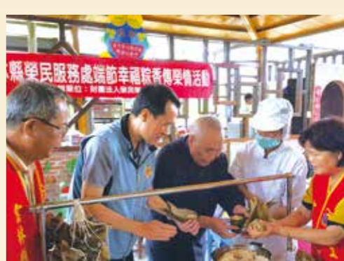
▲雲林縣榮服處致送榮民愛心肉粽。