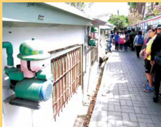
巷內的家用小型抽水機彩繪布置成大頭兵，展現居民巧思。