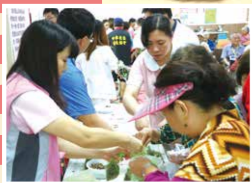
▲北榮員山分院現場包養生粽。