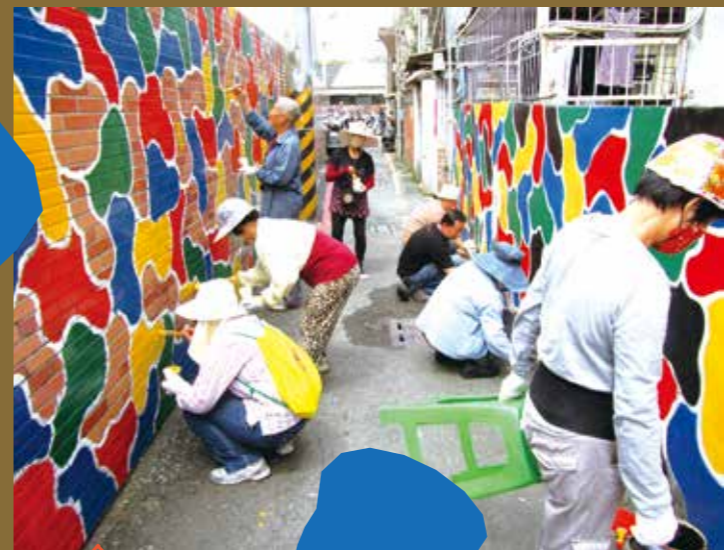
當地住戶與志工一起彩繪，讓社區活了起來。

第三點是身心是否放鬆。睡前可搭配放鬆呼吸或其他放鬆身心的練習，避免持續的憂慮、憂鬱想法、想事情等等。若真的睡不著，不用逼自己趕快睡覺，避免更多思考活動或焦慮緊張，讓自己更難入睡。此時可以離開床鋪，到其他房間做些靜態事務，或單純靜靜觀察自己的狀態。若睡眠問題合併有身心科或其他內外科的困擾，亦可同步求診，以改善睡眠狀況。祝福大家都能一夜好眠。