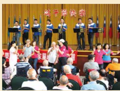
▲舊街哈薩客樂團到彰化榮家演出。