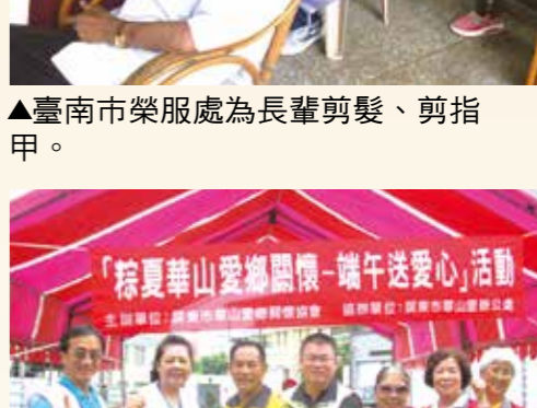
▲屏東縣榮服處結合屏東市華山里舉辦「粽夏華山愛鄉關懷-端午送愛心」活動。