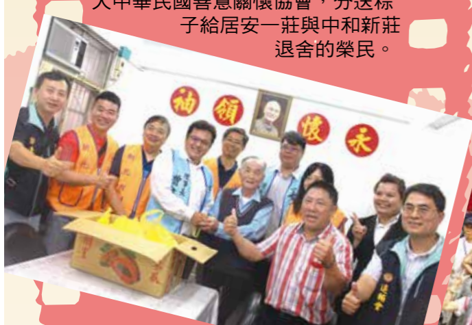
▼新台北市榮服處榮欣志工與社團法人中華民國善意關懷協會，分送粽子給居安一莊與中和新莊退舍的榮民。