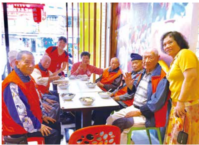
▲板橋榮家提供伯伯友善活潑的安養環境，也常帶伯伯走進社區。圖為伯伯們開心外出吃豆花。

【本刊訊】輔導會為配合政府長照2.0，不斷改善榮家的軟硬體設施，在輔導會與各榮家團隊緊努力下，所屬十八所榮家目前已全部通過衛生福利部「高齡友善健康照護機構」認證，展現輔導會高效率的行動力與政策執行力。