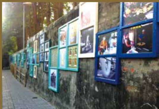
圍牆上掛著各式老照片，呈現早年居民生活風貌。