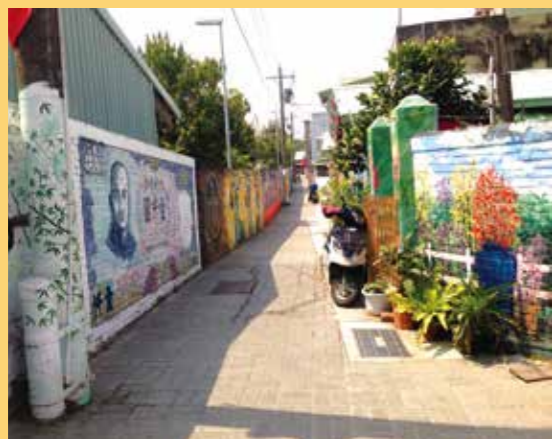
復興老兵文化園區內的巷道，彩繪主題多樣繽紛。