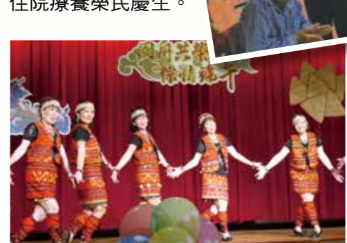
▲高雄榮家「粽情端午聯歡會」有精彩歌舞表演。

臺北榮服處 關懷遺孤榮民眷 在善心人士贊助下，臺北市榮服處舉辦關懷清寒榮民、遺眷及遺孤端午節愛心活動，與榮民、遺眷及遺孤們一同迎端午，活動有魔術表演、摺糖果紙粽、愛心餐會等，輔導會副主任劉樹林也到場向榮民、遺眷及遺孤賀節。