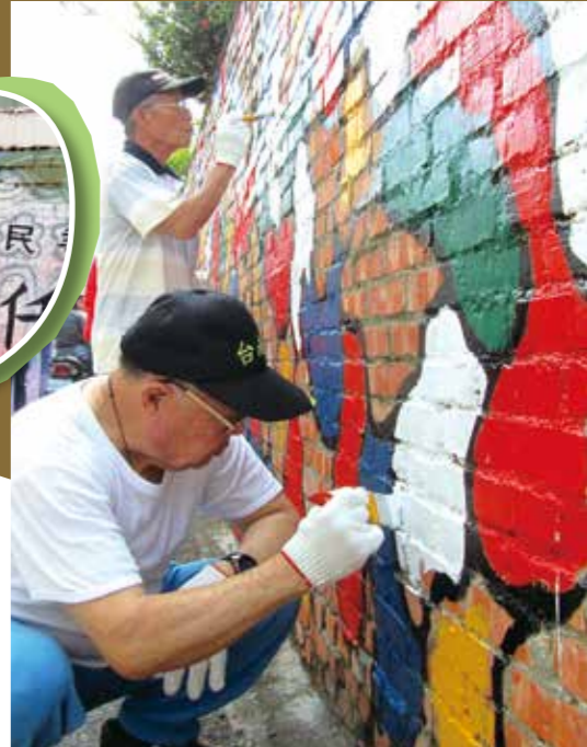
園區內的退伍軍人紛紛加入社區彩繪行列，畫出的圖樣創意十足。