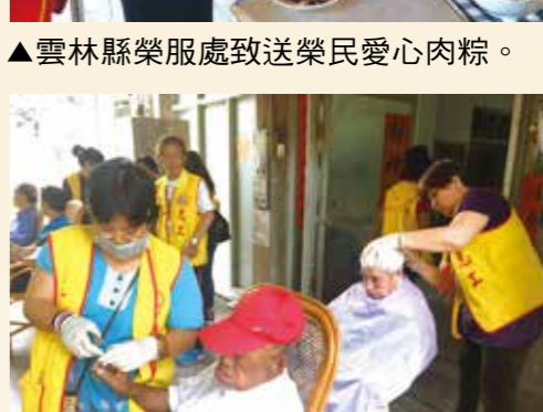
▲臺南市榮服處為長輩剪髮、剪指甲。