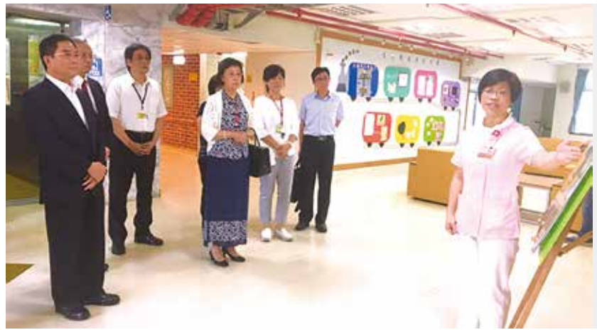
▲監委陳慶財（左）、尹祚辛（右）視察佳里榮家並聽取簡報。

【本刊訊】監察委員陳慶財、尹祚辛日前視察輔導會所屬佳里榮家，聆聽簡報後至榮家頤養大樓參觀榮家失智症單元，兩位委員對佳里榮家的失智症照顧環境頗表讚許，特別是懷舊風格的布景及針對榮民設置的軍旅文化造景感到驚豔，肯定佳里榮家的失智照顧成果。