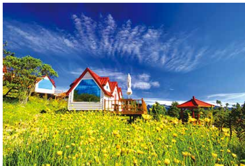
▲福壽山農場美麗的貓耳葉菊花海。

【本刊訊】七月一日開始，第二類退除役官兵只要持權益卡，到輔導會所屬農場旅遊，也能享有門票與住宿比榮民的優惠！適用農場包括清境農場、武陵農場、福壽山農場、彰化農場高雄場區、臺東農場東河休閒農莊、樓閣與明池森林遊樂區。