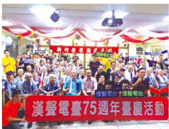
▲新竹榮家住民長輩們與漢聲電臺來賓合影。