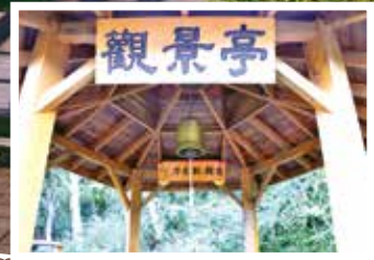
北谷區平安鐘是武陵農場祈福熱門景點。