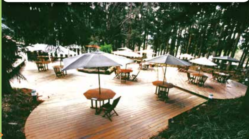
柳杉林環繞的森林咖啡吧，別具特色。

【全票】平日 130 元、假日 160 元 【軍公教、學生、原住民、陸一特、團體】平日 100 元、假日 130 元 【65 歲以上長者、兒童、低收入】一律 80 元 【榮民、持有志願服務榮譽卡、學齡前幼兒、身心障礙及陪同】一律 10 元