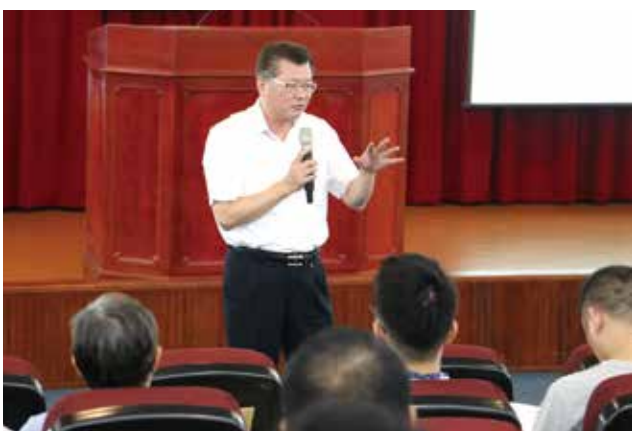
▲輔導會主任委員李翔宙主持「一〇六年退除役特考正額錄取名單」分發作業。（圖／輔導會）

為維護商譽並保障消費者權益，輔導會所屬福壽山農場生產的「福壽長春茶」，結合中華電信推出全新防偽設計新包裝，日前舉辦發表會；輔導會主任委員李翔宙（左）與中華電信國際分公司總經理簡志誠（右）宣示主動打擊仿冒的決心。（圖／輔導會）