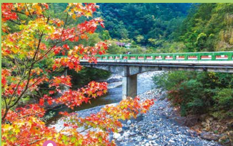
11月的迎賓橋以美麗的楓紅迎接遊客。