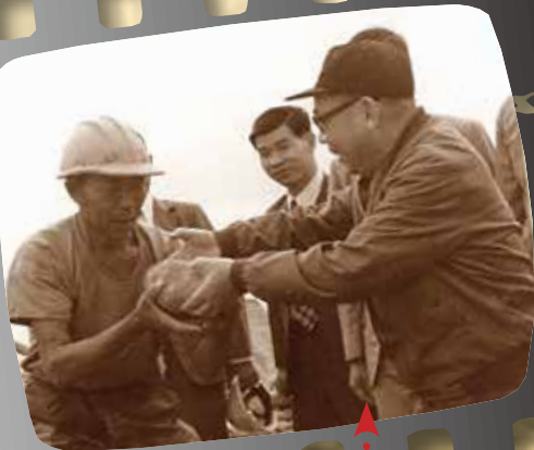
民國63年，建造臺中港的榮民弟兄排成一列，傳遞奠基的卵石，經國先生走入行列，一聲「換我來」，沉重的卵石經過他的手，不斷傳遞下去，象徵「傳承重任，延續歷史。」