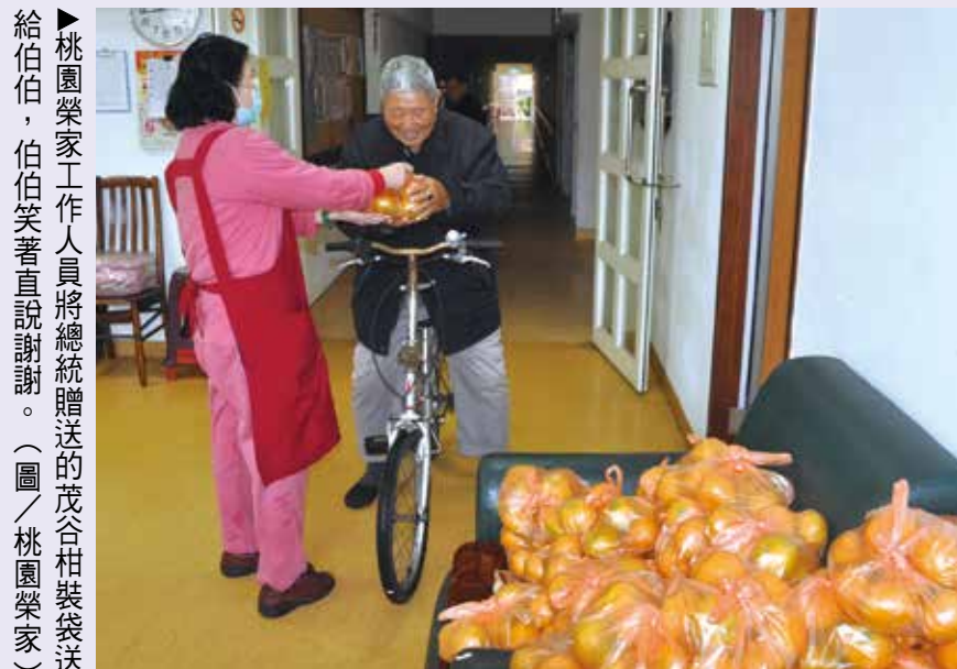
▲桃園榮家工作人員將總統贈送的茂谷柑裝袋送給伯伯、伯伯笑著直說謝謝。

輔導會表示，總統每年都會在農曆春節前贈送各種農特產品給全臺榮家住民與員工，今年也不例外，今年送的是當今水果茂谷柑，每個水果紙箱上都貼著署名總統與副總統的紅色禮卡，並有「敬祝新年快樂」字樣，讓收到茂谷柑的長輩們提前感受到滿滿的春節喜氣。 桃園榮家伯伯拿到一袋袋金黃色的茂谷柑，開心地說，過年吃柑(桔)，象徵「甘甜」、「吉祥」，彷彿一整年的好運都來報到，吃在嘴裡，甜在心裡；也有伯伯將茂谷柑與家人分享，希望全家在新的一年都能吉祥如意。 榮家工作人員為了讓住民儘早拿到總統的贈禮，一早就忙著搬運茂谷柑並裝袋分送，每所榮家大約有一百多箱，工作人員搬得滿頭大汗也不喊累，他們說，要用最快的速度將茂谷柑親自送到每位伯伯的手中，將這份愛傳達下去。