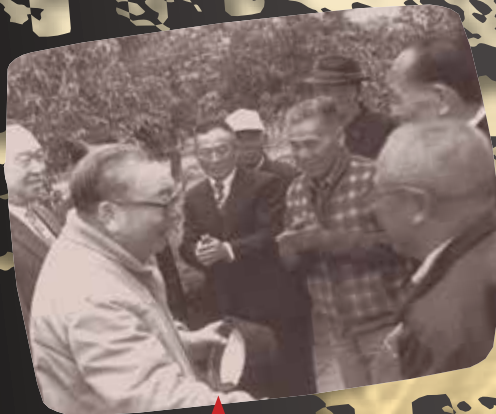
民國70年，經國先生前往岡山榮家，親切與榮民弟兄話家常。