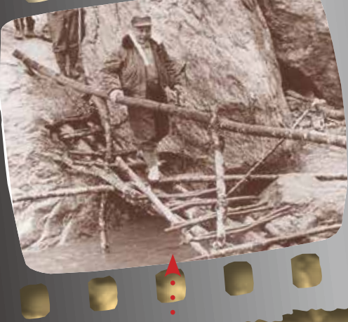
民國53年，「北部橫貫公路」施工沿途無便捷道路可供通行，經國先生走在樹枝搭建的簡易木橋上，不畏險峻前往視察。