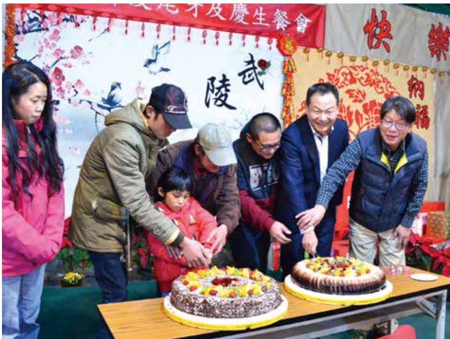
▲主任委員(右2)實現承諾，到武陵農場參加員工慶生餐會。

【本刊訊】眾所矚目的「一〇七年武陵農場櫻花季」將在二月份登場，公路總局日前宣布，今年的總量及交通管制將從二月十六日實施至二月二十五日，每天限制六千人進場；輔導會提醒，欲前往農場賞櫻的榮民(眷)，須注意四大疏運管制措施，並提前預約或購票。 交通部公路總局與輔導會所屬武陵農場、榮民森林保育事業管理處等單位合作，共同規劃場內總量管制、道路