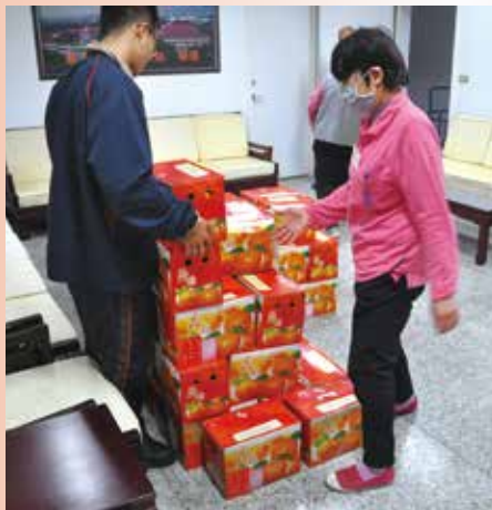
▲總統贈送的茂谷柑，包裝相當喜氣。

輔導會表示，總統每年都會在農曆春節前贈送各種農特產品給全臺榮家住民與員工，今年也不例外，今年送的是當今水果茂谷柑，每個水果紙箱上都貼著署名總統與副總統的紅色禮卡，並有「敬祝新年快樂」字樣，讓收到茂谷柑的長輩們提前感受到滿滿的春節喜氣。 桃園榮家伯伯拿到一袋袋金黃色的茂谷柑，開心地說，過年吃柑(桔)，象徵「甘甜」、「吉祥」，彷彿一整年的好運都來報到，吃在嘴裡，甜在心裡；也有伯伯將茂谷柑與家人分享，希望全家在新的一年都能吉祥如意。 榮家工作人員為了讓住民儘早拿到總統的贈禮，一早就忙著搬運茂谷柑並裝袋分送，每所榮家大約有一百多箱，工作人員搬得滿頭大汗也不喊累，他們說，要用最快的速度將茂谷柑親自送到每位伯伯的手中，將這份愛傳達下去。