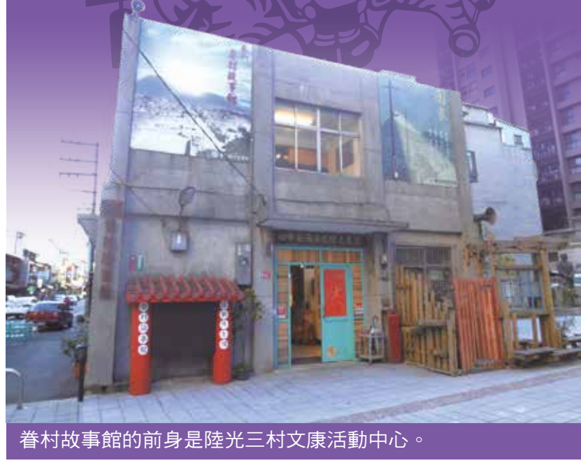
眷村故事館的前身是陸光三村文康活動中心。

除了桃園市政府文化局和民間社團的推動，陸光三村原居民也積極參與眷村故事館的經營，如館內就有紀錄片和聲音箱，以影像和聲音的方式，保留眷村居民的生活回憶，為逐漸凋零的眷村文化留下珍貴紀錄。部分展覽由館方和原居民共同企劃，去年就曾為眷村媽媽拍攝沙龍照，展現眷村女性時尚的一面。另陸光三村原居民也常到這裡聚會，也使眷村故事館多了聯繫居民情感的功能。