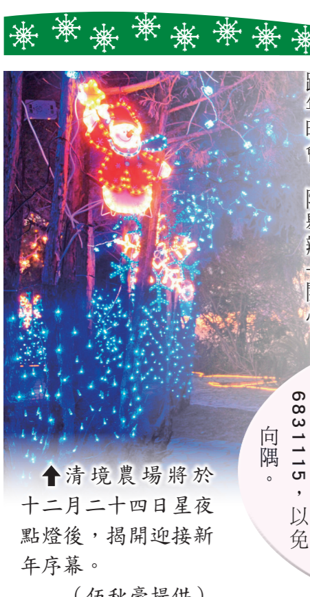
↑清境農場將於十二月二十四日星夜點燈後，揭開迎接新年序幕。

高雄休閒農場推出訂房優惠 （高雄訊）高 雄休閒農場為慶祝民國 一〇一年元旦，當日壽 星憑證住宿三折優惠；一 〇一年慶元宵二月四至六 日連續假期，榮民住宿一 律五折，歡迎把握優惠 活動，儘早電洽07- 6831115，以免 向隅。