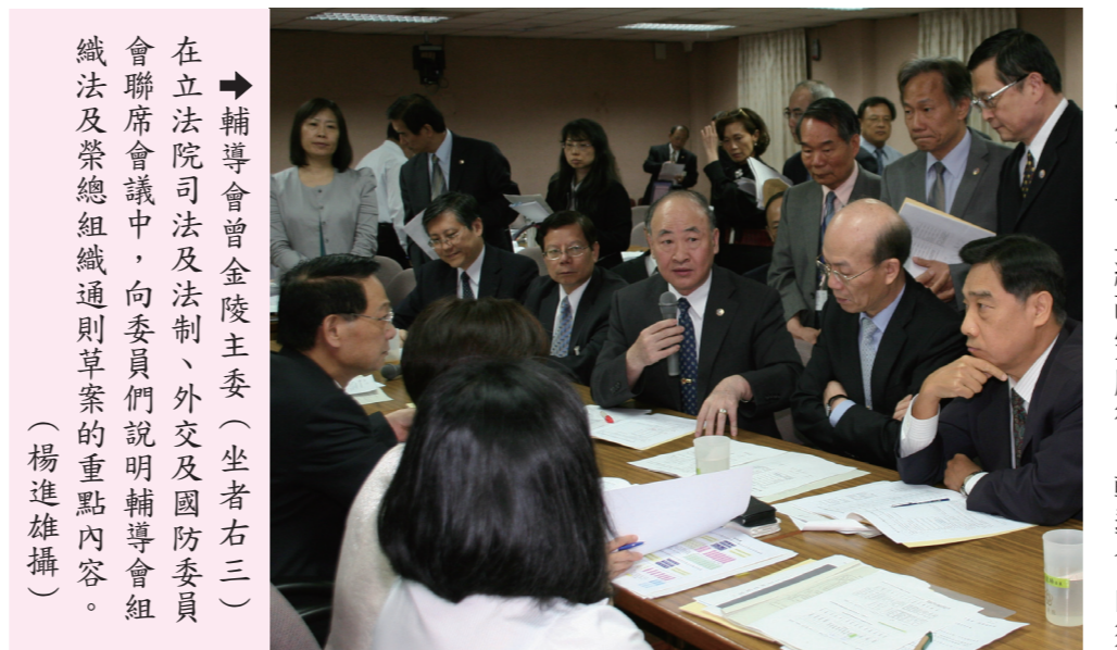
▲輔導會曾主委(坐者右三)在立法院司法及法制、外交及國防委員會聯席會議中,向委員們說明輔導會組織法及榮民總醫院組織通則草案的重點內容。

(本刊訊)立法院司法及法制、外交及國防委員會於日前舉行聯席會,審查「國軍退除役官兵輔導委員會組織法」及「榮民總醫院組織通則」草案,經立委們討論後,初審通過輔導會組織架構,由現行十四個處室、七十所附屬機構,調整為十二個處室、五十八所附屬機構,全案送立法院院會審查。 曾主委於報告時表示,輔導會秉精實、彈性、效能的目標,進行政府組織改造,以建置法制化的行政體系,並依組織整併、員額精簡及業務擴增原則,務求未來組織能順暢運作,並兼顧發展性。 曾主委強調,兩項草案均依政府組織改造精神擬具,以期確立組織核心職能定位,至於在醫療機構的組成部分,注重其經營整合,發揮業務統合功能,提升整體行政效率。 此外,一旦組改完成後,輔導會尚須