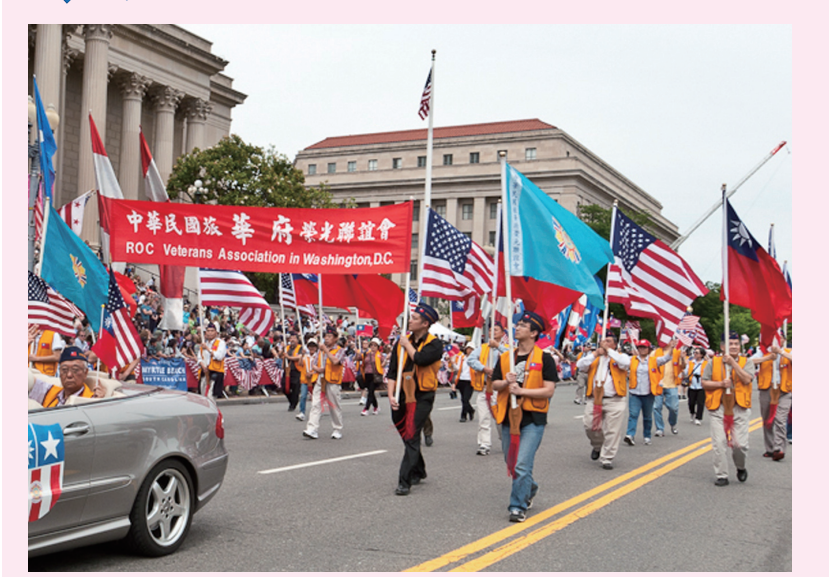
華府榮光會參加美國國殤日遊行