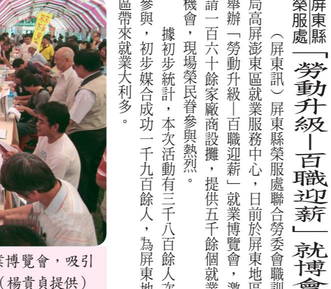
屏東縣榮服處舉辦就業博覽會，吸引許多榮民眷及民眾參加。

屏東縣「勞動升級」百職迎新」就博會 （屏東訊）屏東縣榮服處聯合勞委會職訓局高屏澎東區就業服務中心，日前於屏東地區舉辦「勞動升級」百職迎新」就業博覽會，邀請一百六十餘家廠商設攤，提供五千餘個就業機會，現場榮民眷參與踴躍。 據初步統計，本次活動有三千八百餘人次參與，初步媒合成功一千九百餘人，為屏東地區帶來就業大利多。