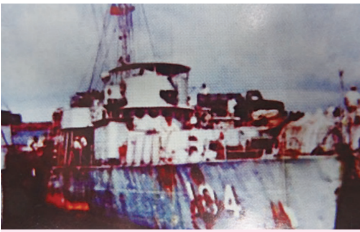
↑沱江艦以一當十，戰至彈痕累累、機艙進水，勉力駛返馬公港。