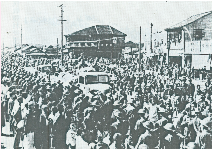
↑三十四年抗戰勝利，國軍官兵進入南京時，受到同胞夾道熱烈歡迎。

三十四年九月九日，聯軍接受日本投降儀式，在日本東京灣美國密蘇里號戰艦上舉行；同年九月九日，中國戰區由時任陸軍總司令何應欽上將，在南京中央陸軍軍官學校大禮堂，代表政府接受日本投降；同年十月二十五日，臺灣地區受降典禮於臺北市公會堂（即今之中山堂）舉行，臺灣、澎湖重歸中華民國版圖。 回顧這八年對日抗戰史，昔日榮民袍澤無怨無悔的犧牲，用鮮血和生命方得寫下今日「軍人節」此一光榮歷史篇章，吾人更應對榮民弟兄及所有曾經投身抗日聖戰的同胞們，表達最崇高的敬意。