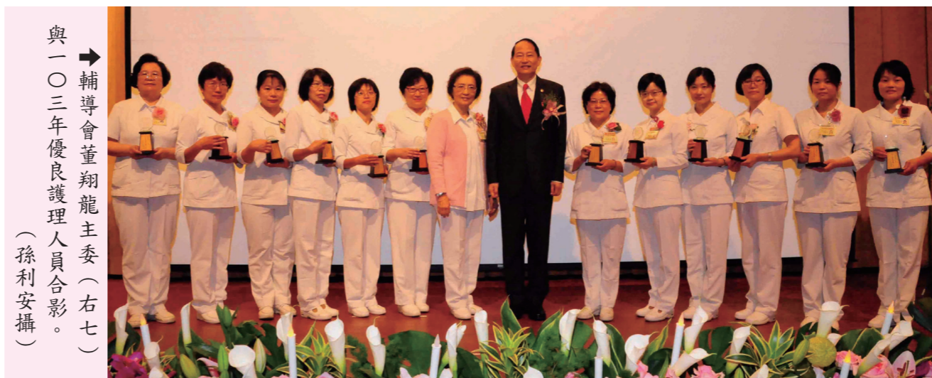
→輔導會董翔龍主委(右七)與一〇三年優良護理人員合影。

(本刊訊)輔導會董翔龍主委日前主持慶祝一〇三年護師節及優良護理人員表揚大會時，期勉護理人員持續以愛心、耐心，關懷照顧病患，使病患均能得到優質的醫療照護服務。 董主委於致詞時，祝福護理同仁們母親節快樂，對於平日的辛勞照顧與服務，代表榮民與家屬，表達敬意與謝意；並表示，服務榮民、照顧榮民是輔導會的核心任務，提供榮民良好的就醫環境與優良的服務品質，是