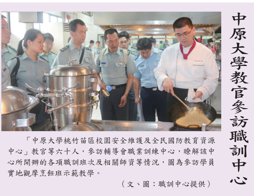
「中原大學桃園苗區校園安全維護及全民國防教育資源中心」教官等六十人，參訪輔導會職業訓練中心，瞭解該中心所開辦的各項職訓班次及相關師資等情況，圖為參訪學員實地觀摩烹飪班示範教學。