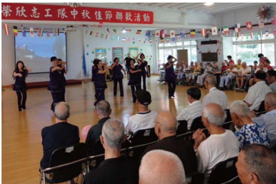
↑桃園縣榮服處榮欣志工組成歌舞表演團，日前於桃園榮家載歌載舞，祝福榮民們秋節愉快。

（本刊訊）秋節期間，輔導會各服務機構分別前往各地區，訪視較需要幫助的榮民眷，並結合各地社福機構，致贈日常生活用品及秋節禮品，讓榮民眷都能歡度中秋佳節。 桃園縣榮服處同仁與榮欣志工，組成表演團，前往桃園榮家，帶來精彩歌舞表演，致贈住家榮民伴手禮及秋節賀卡，大夥共度歡樂時光。 基隆市榮服處結合國際獅子會及基隆市榮民榮眷關懷協會，前往祥和山莊訪視年長榮民，致贈日常生活用品。 臺南市榮服處與臺灣全民食物銀行協會合作，將燕麥片等食品，分送給年長榮民眷，作為秋節賀禮。 高雄市榮服處結合高雄社會局、天功功德會及南投縣名間鄉慈慧宮，將愛心月餅及米、罐頭等物資，發給亟需照顧的榮民眷，祝賀他們中秋佳節愉快。 臺東縣榮服處同仁與榮欣志工，結合華山基金會，致送月餅、白米等生活必需品予榮民，表達關懷；另外，處長曾竹生等前往臺北榮總臺東分院等醫院，慰問住院榮民，祝福早日康復。