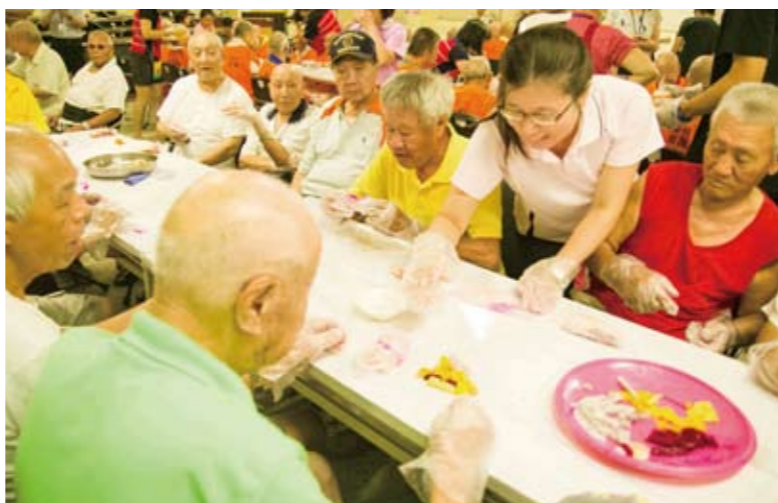
↑二十餘位八德社區大學學員，教導桃園榮家住家榮民們，自己動手做越式春捲。

（本刊訊）桃園榮家日前邀請二十餘位八德社區大學學員，教導住家榮民們自己動手做越式春捲，製作方法簡單，吃來清新又爽口。 榮家及社區大學為配合教學，事先準備越式春捲米紙等各式食材；教學會場上，大夥對越式春捲的製作方式，有別於傳統的中國春捲，都深感好奇，尤其透過捲米紙，包入個人喜好的水果、蔬菜等，再佐以優格或沙拉醬，在炎熱的天氣裡，吃來格外清爽、開胃。