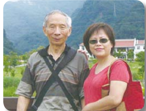
若如夫婦（左、右）出外旅遊時合影。

民國三十七年十月二十三日，在北平西苑營房，我擔任八十七軍汽車連上兵駕駛。晚點名時，連長宣布派十名公差到唐山軍部洽公，問誰願意去？沒人回應，後來連長說，去的人發一套新棉軍服。 北平的冬天，零下一、二十度以下，一套棉軍服穿了一、二年，根本無法禦寒。我一聽出一趟差，可領新棉軍服，誘惑力驚人，於是和同袍前往唐山。 唐山源遠流長，商周時代屬孤竹國，是伯夷、叔齊的故鄉。明清開始在唐山冶鐵、採煤，又成立陶瓷業中心。一八七六年清政府設唐山鎮，因鎮北有山，後以山名為鎮名，改稱唐山鎮，民國二十七年設立唐山市。 與北平相比，唐山只是個鄉鎮，街道窄，店面小，車輛行人也不多。行人衣著多是傳統棉襖棉褲，穿大掛長袍及西裝的很少。婦女包的頭巾，多是布巾，以防風沙及煤塵。 當年軍部駐在煤礦公司，我們汽車排住在一幢平房舊長官公署，屋前空地可以停車。到軍部出差，有機會下礦坑看看，才發現唐山市是被「架空」的城市，礦坑中支柱雖然密布，但像個危樓，一旦戰火蔓延到唐山，大砲一轟，可能會整個崩塌。 戰火在東北蔓延得快，唐山市面卻安靜如恆，行人熙來攘往，燒雞店