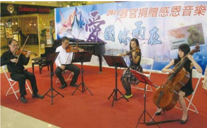
▲高雄榮總舉辦器官捐贈感恩音樂會，向器捐者表達追思與感念。

高雄榮總(高雄訊)高雄榮總日前於該院醫療大樓舉辦「器官捐贈感恩追思音樂會」，邀請器官捐贈者家屬代表，分享面臨家人生命末期時，展現大愛的心路歷程，並請器官移植受贈者，分享重獲新生的經驗。音樂會中，邀請六位音樂老師，以各種樂器演奏悠揚的樂曲，藉以傳達對捐贈者的敬佩、感恩與懷念之情。