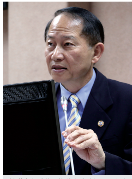
輔導會主委董翔龍赴立法院報告，為強化募兵誘因提出政策說明。

就業方面，輔導會自去年十月開始持續推動人力資料庫建立，針對不同需求擴建求職與求才網路就業媒合平台，做到完善退前輔導，透過網頁、臉書、軍中媒體宣傳推動，協助順利找到工作。