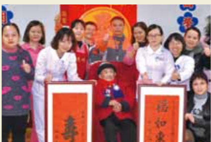
陳在雅爺爺華年瑞壽