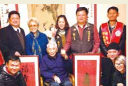
錢江潮爺爺福壽雙臻