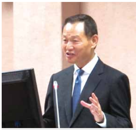
主委李翔宙到任後，向立法院外交及國防委員會業務報告，說明輔導會今後重點工作。

【本刊訊】輔導會新任主委李翔宙向立法院外交及國防委員會業務報告表示，未來輔導會有六項重點工作，包括：廣續推動退除役官兵服務照顧工作；並配合募兵政策，置重點於服役四至九年之青壯及低階退除役官兵在就業、就業上的多元化需求，以提升他們的就業競爭力，順利退後就業。二、寬整年金改革意見，爭取合理權益，規劃藉由辦理「榮民代表懇談會」、「服務網座談」及訪視榮民等時機傾聽民意，於八月底前完成與革意見寬整。 六項重點工作如下： 一、廣續推動退除役官兵服務照顧工作：在既有基礎上，持續推動退除役官兵的服務照顧工作。並配合募兵政策，置重點於服役四至九年之青壯及低階退除役官兵在就業、就業上的多元化需求，以提升他們的就業競爭力，順利退後就業。 二、寬整年金改革意見，爭取合理權益，規劃藉由辦理「榮民代表懇談會」、「服務網座談」及訪視榮民等時機傾聽民意，於八月底前完成與革意見寬整。