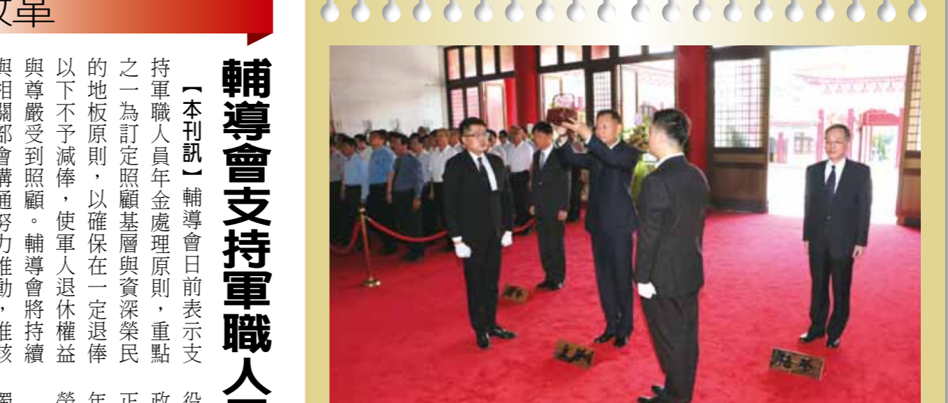
中元祭悼在臺亡故榮民。輔導會日前於北部、中部、南部及東部地區分別舉行中元節祭典，其中主委李翔宙與臺北地區榮民代表等，在臺北市軍人公墓忠烈祠祭殿，向歷年在臺保國衛民及參與經建、深耕社會的亡故榮民，表示尊崇與緬懷。