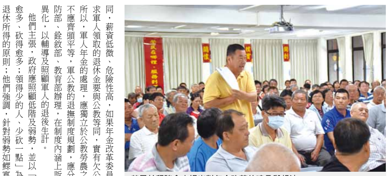
榮民於懇談會中提出對年金改革的建言與想法。

【本報訊】輔導會日前表示支持軍職人員年金處理原則，重點之一為訂定照顧基層與資深榮民的地板原則，以確保在一定退休以下不予減俸，使軍人退休權益與尊嚴受到照顧。輔導會將持續與相關部會溝通努力推動，惟該處理原則均需依年金改革委員會討論決議辦理。 輔導會表示，國防部於第六次年金改革委員會中提出「軍職人員年金應單獨處理」專案報告，該會考量軍人是簽賣身契及生死狀效國家，理應獲得保障，特別表示支持。 輔導會支持的軍人年金改革四項原則是：一、軍人具特殊性，應與公教切割，單獨處理；二、服務年限應與公教切割，單獨處理；三、服務年限應與公教切割，單獨處理；四、服務年限應與公教切割，單獨處理。 針對服役四至九年退伍者的退撫支出，由政府編列公務預算支應，可免除退撫基金支出。至於修正服役年限，延後請領退休金之年齡，可留用軍事專長人力，延緩退撫基金流失。 有關訂定照顧基層與資深榮民的地板原則，可確保軍人的退休權益與尊嚴受到照顧。