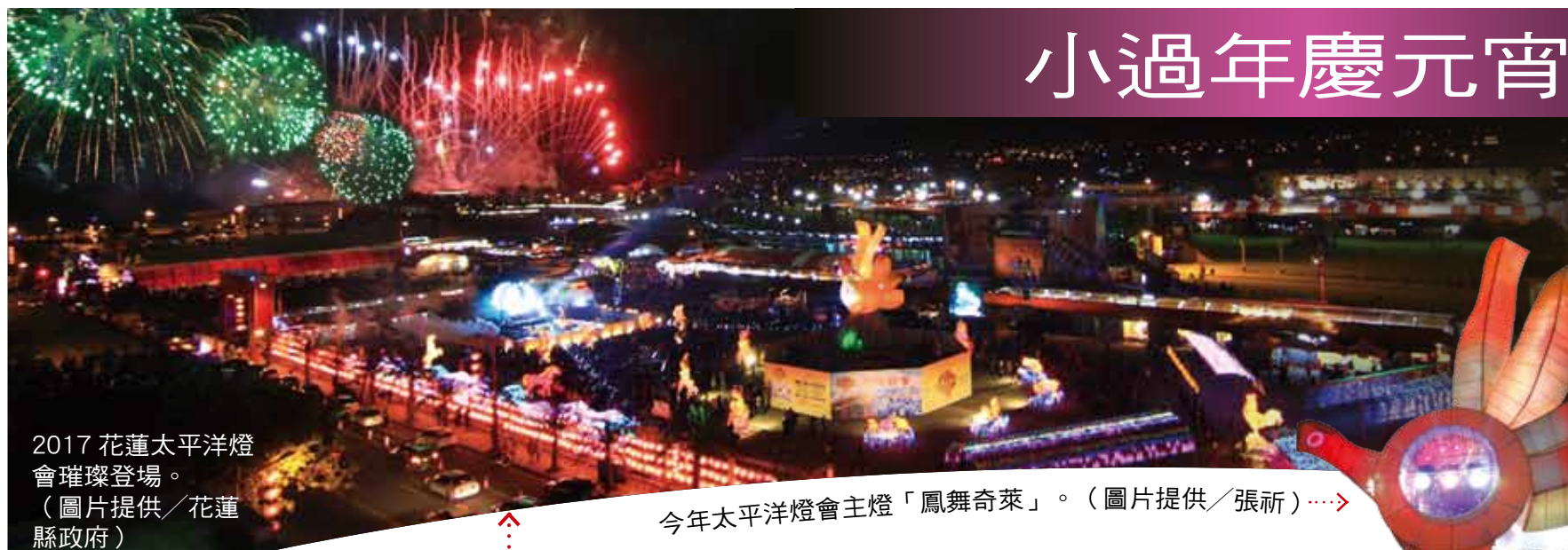
2017 花蓮太平洋燈會璀璨登場。 (圖片提供／花蓮縣政府)