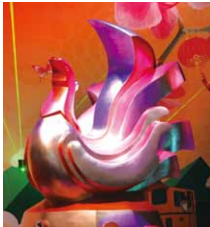
今年臺灣燈會主燈「鳳凰來儀」。

正月十五元宵節是臺灣具代表性的傳統文化節慶，重要程度僅次於農曆新年，因此有「小過年」之稱。各地皆有慶元宵的相關活動，尤其璀璨豐富的燈會，更為新年增添熱鬧氣氛。今年何處賞燈去？以下介紹三處燈會，歡迎大家前往，一飽眼福。