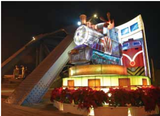
虎尾鐵橋旁的火車頭花燈，充滿糖都趣味。

此外，鯉魚潭有身兼「花蓮觀光大使」的紅面鴨，帶來深受民眾好評的「紅面福鴨水舞秀」。鄰近燈會旁的東大門國際觀光夜市，在活動期間還齊聚了