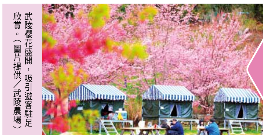
武陵櫻花盛開，吸引遊客駐足欣賞。

【本刊訊】適逢大地回春，各地都有櫻花綻放，枝頭爭豔的消息，其中頗具代表的，非武陵農場莫屬。