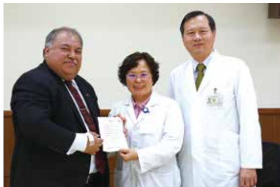
諾魯總統瓦卡（左）感謝中榮院長許惠恒（右）、營養室主任楊妹鳳等醫護人員的醫療協助。

【本刊訊】臺中榮總優質醫療聲名遠播，連遠在南太平洋的我國友邦諾魯共和國都讚嘆不已，甚至在一六至二〇一〇年的「國家衛生策略計畫書」中，將中榮指定為醫療發展夥伴，列入海外醫療轉診醫院之一。諾魯總統瓦卡日前來臺，特地到中榮參訪，並感謝中榮院長許惠恒及全體醫護人員多年來提供諾魯多方位的醫療協助。