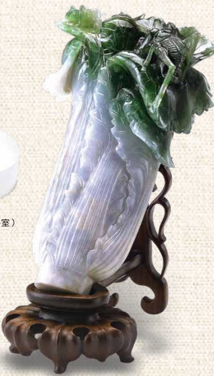
翠玉白菜。

提起《翠玉白菜》，幾乎家喻戶曉，也形同臺北故宮博物院的代言寶物。其實，它並非臺北故宮唯一的玉白菜，而是院藏三棵玉白菜當中最美、最吸睛的一棵。在「南北故宮·國寶薈萃」的白菜主題展覽會場，觀眾可以細細地欣賞它們的真貌，以及巧雕趣味。 我們熟悉的《翠玉白菜》，長十八點七公分，寬九點一公分，厚五點零七公分，成型的《翠玉白菜》最初並未受重視，是被放在瑤瑤小花盆中。據專家說，這一件《翠玉白菜》原本被放在紫禁城的「永和宮」。「永和宮」是清朝光緒皇帝的瑾妃住處，傳說是西元一八九〇年瑾妃入宮的嫁妝。因白菜寓意家世清白，白菜葉子上的兩隻昆蟲代表多子多孫的祝禱，是一件吉祥之物。