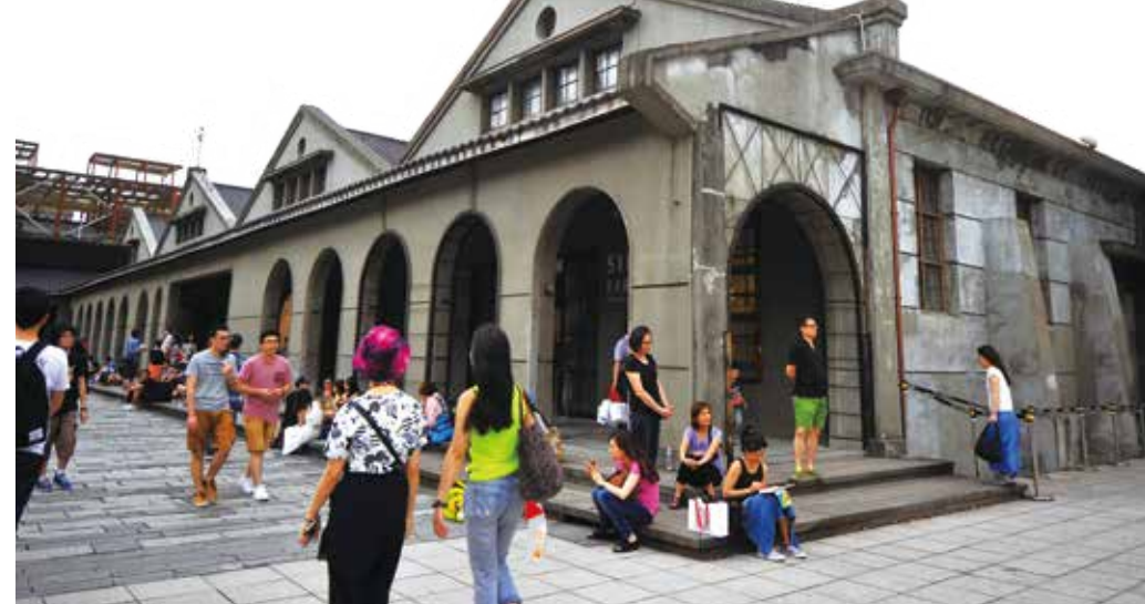
臺北市松山文創園區每到假日就吸引許多民眾參觀。

若計畫創造自己的文創事業，建議初期應先於一至三個核心主題，這個核心主題應與自己的生命經驗與性靈相關，並了解自己第二人生的使命方向為何？內心的熱忱所在？正所謂「心如工畫師，一切唯心造」，進而與文創達人或專家顧問對話諮詢，釐清「定位」、「產品服務根本差異化」、「營運獲利模式」，準備紮實的基本工夫與營運執行計畫，妥善運用退伍後的本金；平時也可多關注政府的創業資源，如文化部、產業發展局的創業計畫、行政院國發基金創業天使等計畫，申請政府的創業補助。 一旦決定投入文創事業，只要將第二人生的方向與創業基本議題思量清楚，再與團隊夥伴們共同推動執行，將能提高創業成功率，再創生命榮光。