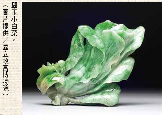
翠玉小白菜。

已故的故宮器物專家那志良先生，生前接受筆者訪問時曾提及，他初次看到的《翠玉白菜》，是和一棵小靈芝一起種在瑤瑤花盆裡，也許是點綴清朝宮中的「盆景」之一。一九二五年十月十日，北京故宮博物院成立後，那先生和一群專家開始著手整理故宮的銅器、瓷器、玉器、繪畫等文物；他是負責玉器。當《翠玉白菜》出現在庫房時，眾人眼睛一亮，不過它身旁那棵小靈芝實在無法與它匹配，瑤瑤花盆也顯得土裡土氣的，所以當玉器陳列室成立，挑選展品時，就讓白菜脫離小靈芝，獨自亮相。