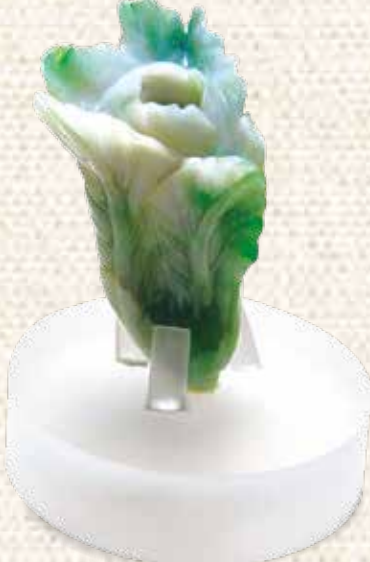
翠玉白菜花插。