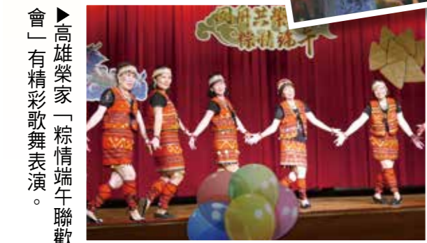
▲高雄榮家「粽情端午聯歡會」有精彩歌舞表演。

臺北榮服處 關懷遺孀榮民眷 在善心人士贊助下，臺北市榮服處舉辦關懷清寒榮民遺孀及遺孤端午節愛心活動，與榮民、遺孀及遺孤們一同迎端午，活動有魔術表演、摺糖果紙粽、愛心餐會等，輔導會副主委劉樹林也到場向榮民、遺孀及遺孤賀節。