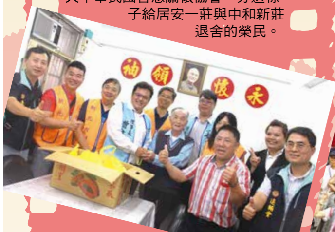
▼新北市榮服處榮欣志工與社團法人中華民國善意關懷協會，分送粽子給居安一莊與中和新莊退舍的榮民。