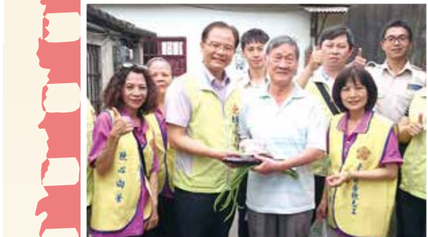
▲臺北市榮服處「關懷清寒榮民遺孀遺孤端午節愛心活動」，現場熱鬧溫馨。