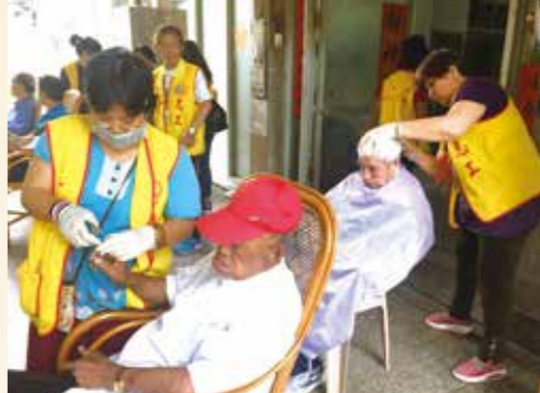
▲臺南市榮服處為長輩剪髮、剪指甲。