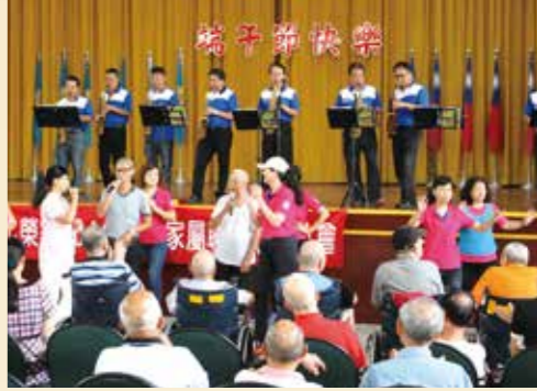
▲舊街哈薩客樂團到彰化榮家演出。