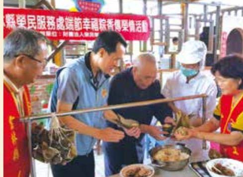
▲雲林縣榮服處致送榮民愛心肉粽。