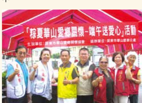
▲屏東縣榮服處結合屏東市華山里舉辦「粽夏華山愛鄉關懷端午送愛心」活動。