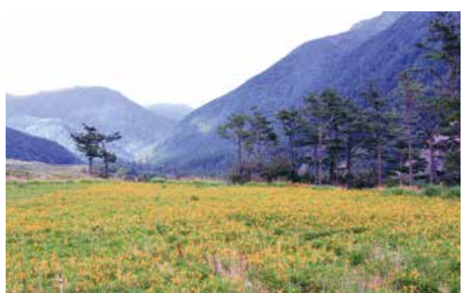
現在是金針花盛開的季節，金黃色的花海，有如來到忘憂仙境。

也是通往桃山瀑布和雪山東峰的必經之路，夜宿武陵農場的遊客，可考慮安排北谷秘境之旅。 北谷景點之一高山植物園位於雪山登山口下方，園內有生態水池、水中植物池、中藥園區、草園區，並種有臺灣原生針葉林、落羽松、青楓等高山植物，是高山耕種造林的典範。另外，園內還有一座景觀亭，亭內設有一個平安祈福鐘，是民國一〇二年七月二十九日武陵農場成立五十週年時，由法鼓山方丈果東法師加持啟用，讓信佛佛教的遊客，在休息時可以順便祈求平安。