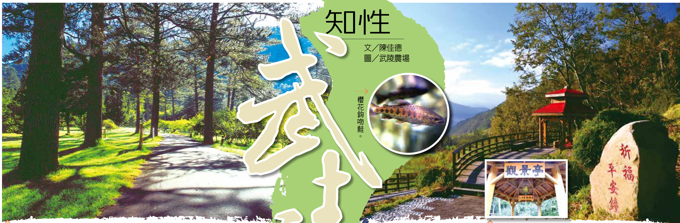
漫步在南谷區松林大道的二葉松下，可體會高山初秋的氛围。

「福田」 榮民榮譽 贈專戶 團法人榮 基金會 行： 庫銀行 南路分行 收帳號： -626-734 局： 劃撥帳號 2111