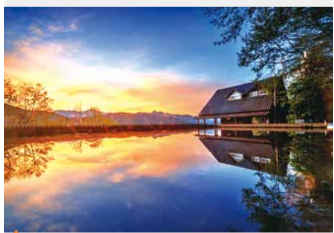
在雪山登山口前，幸運遇見絕美的山光水色。

色棋盤，景色秀麗別致；盡頭的農莊文物館，記錄著當年榮民辛苦開墾農場的點滴，走累了，可回到茶館，品嚐一壺味道清香、口感甘甜的武陵茶，細細品味武陵農場的農產特色。