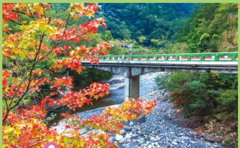
11月的迎賓橋以美麗的楓紅迎接遊客。