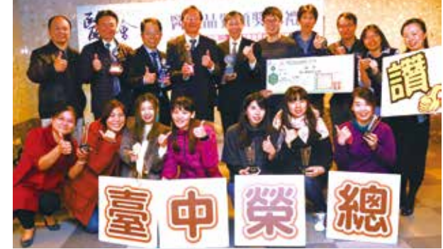
▲中榮團隊在第18屆醫療品質獎中表現優異。

【本刊訊】財團法人醫院評鑑暨醫療品質策進會舉辦的「第十八屆醫療品質獎」日前揭曉，輔導會所屬三所榮總獲得多個獎項，堪稱大贏家。其中高雄榮總獲二金四銀一銅二佳作、一潛力、四標準及二座人因特別獎，臺中榮總獲一金一銀一銅一優選四佳作及三標準，臺北榮總獲一金一銅一佳作及七潛力獎，表現亮眼，不僅醫療實力受肯定，也成為各機構學習的對象。 「第十八屆醫療品質獎」在鼓勵醫療機構運用資訊科技降低錯誤、提高效率，進而提升醫療品質與病人安全，三所榮總能在眾多競爭對手脫穎而出，相當難得。 高榮在提升高齡病人的用藥整合率及文獻查證臨床組獲金獎，並獲四項智慧醫療獎章；中榮在擬真情境急重症照顧新人組中獲得金獎及三項智慧醫療獎章；北榮在文獻查證普英組奪得金獎，並以提升住院病人口腔清潔率等表現獲七項潛力獎。