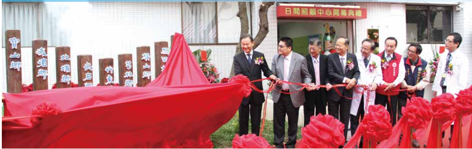
▲北榮新竹分院日照中心在主任委員（左1）等人揭牌下熱鬧開幕，9個鄉鎮立牌代表日照中心服務涵蓋範圍。

【本刊訊】輔導會配合政府長照2.0政策，讓高齡長輩在地安老，積極籌設日間照顧中心、護理之家、高雄榮總屏東分院與臺北榮總新竹分院日前分別舉行日照中心揭牌開幕儀式；主任委員李國軍致詞時表示，輔導會二所榮總與十一所分院都已獲日照中心設置許可，未來全國榮總的服務據點都將設置日照中心，將榮總累積十五年的高齡醫療長照經驗，轉化為完整模式，建立十項照顧高齡長輩的作業準則，推廣到全國，拓展為服務社會的資源。 高榮屏東分院日照中心由主任委員與屏東縣長潘孟安共同揭幕。主任委員表示，很高興見證內埔鄉第一家日照中心成立，這代表榮總的醫療服務能量在屏東擴張；除榮總體系外，已成立社區照顧關懷據點的輔導會所屬十六所榮家，預計明年也要成立日照中心，這對高齡長輩的長期照顧是非常重要的及值得推廣的。 屏東縣長潘孟安表示，高榮屏東分院日照中心服務內埔鄉親，更擴大到屏東北鄉鎮，期待高榮成為社區醫療、居家照顧和高齡醫療的後盾。 日照中心可服務三十位輕度與中度失能民眾，由護理師、社工師、營養師及照顧服務員等組成專業團隊，落實長照在地化及普及化。另外，高榮屏東分院斥資一億五千萬興建有一九九個床位的護理之家，也同時舉行動土儀式，預計一〇八年初完工，服務對象以單身、年邁、無依、經濟弱勢的失能榮民為主，同時提供臨時托顧、醫療、復健、日常照顧等多元服務。 北榮新竹分院日照中心，讓鄉親安心上班。北榮新竹分院成立的日照中心也於日前熱鬧開幕，這是新竹縣境內第一間日照中心，唯一由醫院成立的日照中心，主打「照顧您家長輩，讓您安心上班」。主任委員、客委會副主任委員范佐銘、新竹縣副縣長楊文科等人均出席。 主任委員致詞表示，輔導會積極配合政府的長照政策，去（一〇五）年成立專案編組，建立長照工作的一致性作業規範；對高齡長者所需的輔助器具也做統一規劃，以推廣更為便利可近的服務。 院長彭家勳表示，北榮新竹分院日照中心可服務三十位長者，是新竹縣第一間依據長期照顧服務法取得合法設立許可的社區式長期照顧機構，同時提供醫院專業團隊的醫療支援照顧，中低收入及弱勢家庭另可申辦補助。