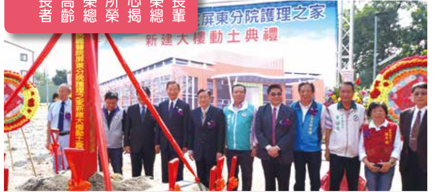
▲高榮屏東分院護理之家動土，將提供失能榮民多元服務。