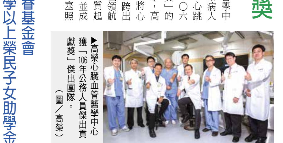
▲高榮心臟血管醫學中心獲「106年公務人員傑出貢獻獎」傑出團隊。