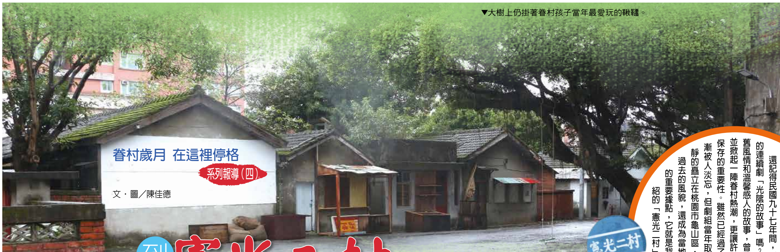
▼大樹上仍掛著眷村孩子當年最愛玩的鞦韆。