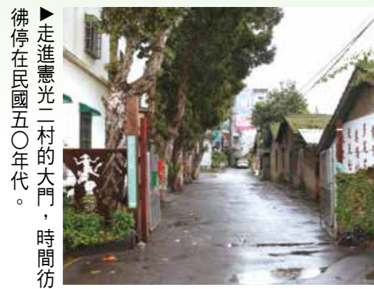
▲走進憲光二村的大門，時間彷彿停在民國五〇年代。

提供憲兵軍官居住；丙種房舍是一房一廳一衛，為憲兵士官住所。公寓房舍最初是一座水塘，兒童夏天常會在這裡戲水嬉戲，民國六十二年改建成為四棟公寓，提供更多憲兵眷屬入住，確定憲光二村的規模。 憲光二村之所以能夠保留，與原居民的團結向心有很大關係。同樣是眷村子弟的鄭小姐說，民國九十五年馬祖新村成為桃園第一個保留眷村後，龜山也掀起了保留運動，只有憲光二村原居民最積極，因此成為龜山唯一獲得保留的眷村。儘管憲光二村沒有入選國防部十三處「國軍老舊眷村文化保存區」，但更貼近一般眷村居民的生活場景，成為電視節目製作人王偉忠青睞的取景地。