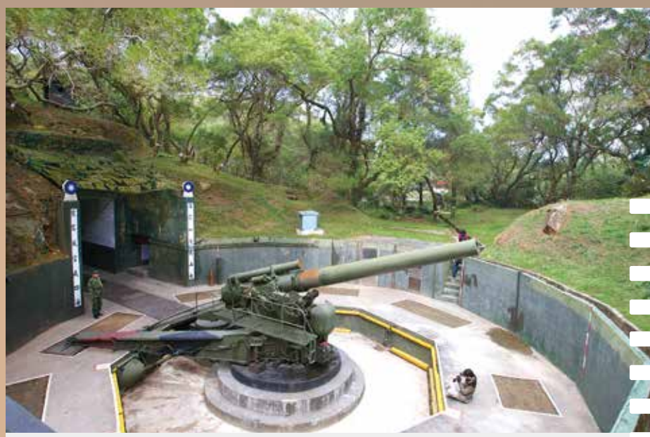
▲240榴彈砲是619砲戰中，國軍戰勝的關鍵，為臺海和平奠定穩固的基礎。

倘若家人或親友有相關問題，歡迎至失智相關門診接受評估與治療，例如北榮臺東分院每日均有身心科門診，只要早期發現、早期治療，仍能延緩功能退化，維護生活品質。