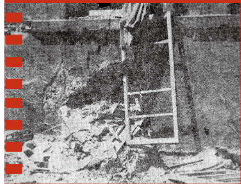
▲619砲戰中被中共砲擊的醫院一景。（圖／本刊資料室）