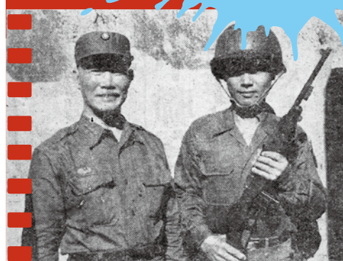
▲619砲戰後，當時的副總統陳誠身穿戎裝，視察金門陸軍部隊。