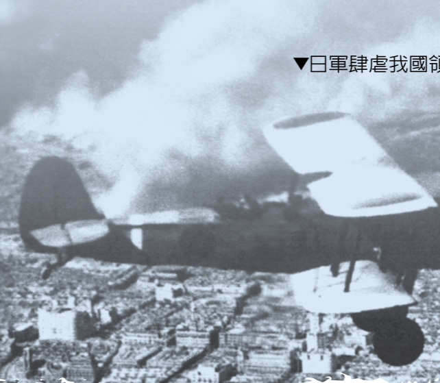
▼日軍肆虐我國領空，造成軍民大量傷亡。

無懼日機壓境 健兒奮勇應戰 當天日軍鹿屋航空隊共十八架轟炸機由臺北松山機場起飛，以九架飛機為一組，分頭對寬橋、廣德兩地發動攻擊，第四大隊於下午才陸續飛抵寬橋基地，空襲警報大作，高志航及部分隊員立即登機，有些戰機已來不及加油，但因情況緊急仍升空應戰。