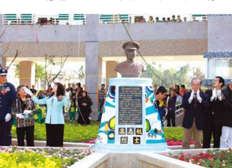
▲高志航烈士塑像於嘉義市志航國小揭幕。

空軍部隊首要任務就是捍衛領空、殲滅敵軍，故須具備機警且精確的作戰能力，高志航嚴格要求隊員的技術水平，例如炸命中率必須達到百分之九十以上，如在操課訓練時，成績未達標準者，希望隊員以不休息、不吃飯的態度，自我要求達到規定成績，方才結束操課。