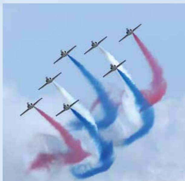
▲814 空軍節的背後，有著空軍的奮戰精神。圖為民國 106 年紀念儀式中的空軍特技表演。