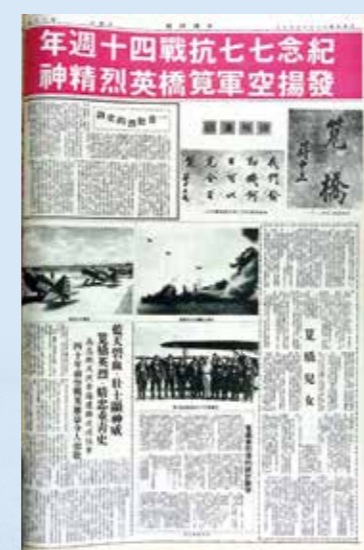
▲民國 66 年 7 月報紙曾刊出「紀念七七抗戰 40 週年，發揮空軍寬橋英烈精神」的系列報導。

來襲者是九架九六式重轟炸機，初時敵機躲入上空雲層，準備偷襲，其中一架竄出，低飛投彈後，行蹤被我軍發現並朝其開火，敵機中彈未傷及要害，意圖再躲入雲層。就在此時，高志航、譚文忠從兩側竄出，開火擊中後座槍手，再對準機體射擊，猛烈一聲巨響，敵機爆炸墜落地面，