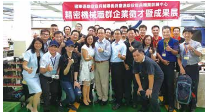
▲職訓中心精密機械職群所屬的 CNC 多軸銑床班日前結訓，成為產業生力軍。

【本刊訊】輔導會職訓中心一〇七年上半年精密機械職群所屬的 CNC 多軸銑床班日前結訓，經過九〇四小時的扎實訓練，學員們不僅順利取得證照及相關認證，並舉行成果發表會，獲得與會的學界及企業界代表一致讚賞並表示，職訓中心精密機械職群所培養的學員，將成為智慧機械產業的重要人才，期許學員繼續精進專業智能，在業界發光發熱。