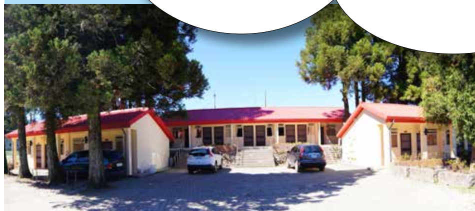
▲夜宿唐莊，舒適、便利又安全。