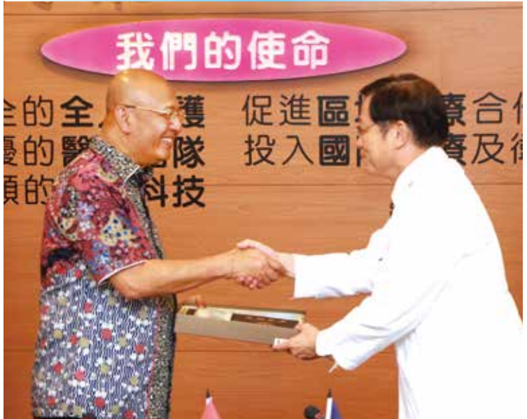
▲印尼棉蘭市長祖爾米（左）感謝高榮的醫療協助，並與院長劉俊鵬（右）互贈紀念品。

【本刊訊】高雄榮總配合新南向政策，積極與印尼展開醫事合作，不僅與印尼棉蘭多所醫療及學術機構簽訂合作備忘錄，並多次赴當地義診，長期提供棉蘭醫療協助。印尼棉蘭市長祖爾米日前特別到高榮，向院長劉俊鵬表達感謝，並表示未來將與高榮在醫療技術上持續合作與交流。 高榮秉持「授人以魚，不如授人以漁」的精神，安排印尼實習醫生至高榮學習醫療技術，今（一〇七）年已與印尼棉蘭鵝城基金會、棉蘭大學、棉蘭皇家醫院及棉蘭牙科醫院簽訂合作備忘錄，為當地培育四十位實習醫