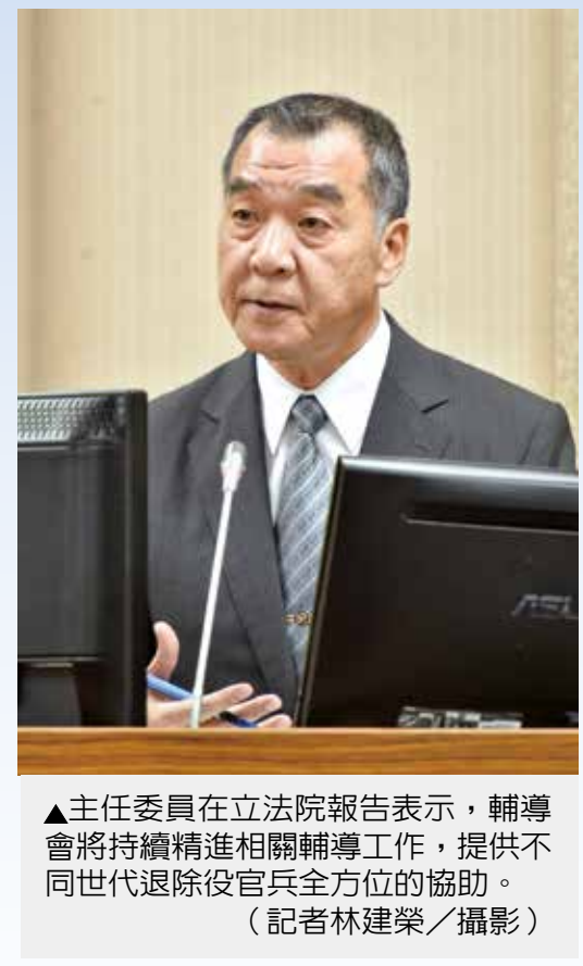
▲主任委員在立法院報告表示，輔導會將持續精進相關輔導工作，提供不同世代退除役官兵全方位的協助。

主任委員表示，輔導會自今（一〇七）年七月起試辦「促進退除役官兵穩定就業方案」，協助退除役官兵安居樂業，預估年底前有一千四百餘人符合申請資格（包括符合推介就業資格者八百餘人、訓後就業資格者八百餘人），總計將發放穩定津貼八百餘萬元。 主任委員並指出，考量服務對象增加，青壯退除役官兵，及配合政府推動長照2.0政策，輔導會將抱持創新前瞻及任事負責的態度，持續跨部會、跨領域資源整合的思維，勇於面對挑戰與轉型變革，戮力推動各項服務工作，務使退除役官兵都能獲得符合需求的輔導與服務。 與會的立法委員們並祝賀主任委員是我國首位獲選列入美國陸軍戰爭學院名人堂的軍官。主任委員謙虛表示，我國每年都會送一位軍官赴美國陸軍戰爭學院受訓，這些學長或學弟們也都非常的優秀，「我是運氣好，後來擔任了陸軍司令與參謀總長，於是符合了列入名人堂的獲選要件。」 主任委員並勉勵學弟們，「雖然種瓜不見得一定會得瓜，但