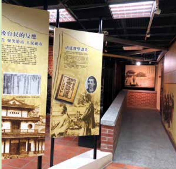
「1895 八卦山抗日保台史蹟館」是全臺唯一以八卦山戰役為主題的文史館（上圖）；館內有通道通往防空洞（左圖）。