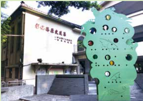
↑彰化市中山國小文學園，記錄傑出校友的詩文。

老校有出名校友，還有老樹，校園裡的蓮霧樹及芒果樹，陪伴三代甚至四代中山人成長。中山國小也保存了一九三〇年建造的北棟教室，以重複、幾何圖形的結構表現美感，雙斜式文化瓦屋頂、連拱型