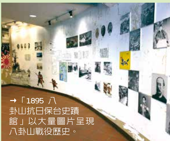
→「1895 八卦山抗日保台史蹟館」以大量圖片呈現八卦山戰役歷史。

鄰近忠靈塔，八卦山天空步道順著八卦山勢搭建，全長一〇〇五公尺，設置七個出入口，全年開放。八卦山抗日保台史蹟館有一條地下水脈，溯源而上，與一百公尺外的彰化紅毛井相通，再往北走的明顯湧泉處在彰化市中山國小。