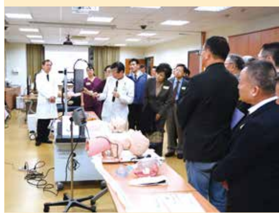
↑「惠康杏林培育中心」加強「真訓練」，精進一線醫事人員的急重症照護能力。

編按：輔導會所屬榮總不僅在醫療技術上持續提升實力，獲得國際重視，並屢獲國內外大獎；社會善心人士肯定榮總的努力，特別捐贈先進醫療設備，使更多病患受益。《榮光雙周刊》整理三所榮總的得獎紀錄與精進作為，和企業家的善行，見證榮總專業與優質的醫療成果，與社會的善心回饋。