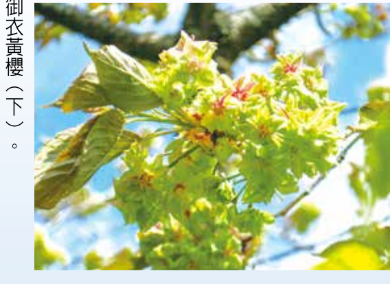
→福壽山農場的一葉櫻(上)與御衣黃櫻(下)。

福壽山農場種植約五百餘株梅樹，花色與種類豐富，在新春期間，紅的、粉的、白的、黃的、綠的梅花相繼盛開，把農場妝點得萬象繽紛，最特別的是在松廬與福壽山莊前的鴛鴦梅，可以看到同一朵梅花出現一半紅一半白的特殊品種，總讓遊客嘖嘖稱奇；另於果樹