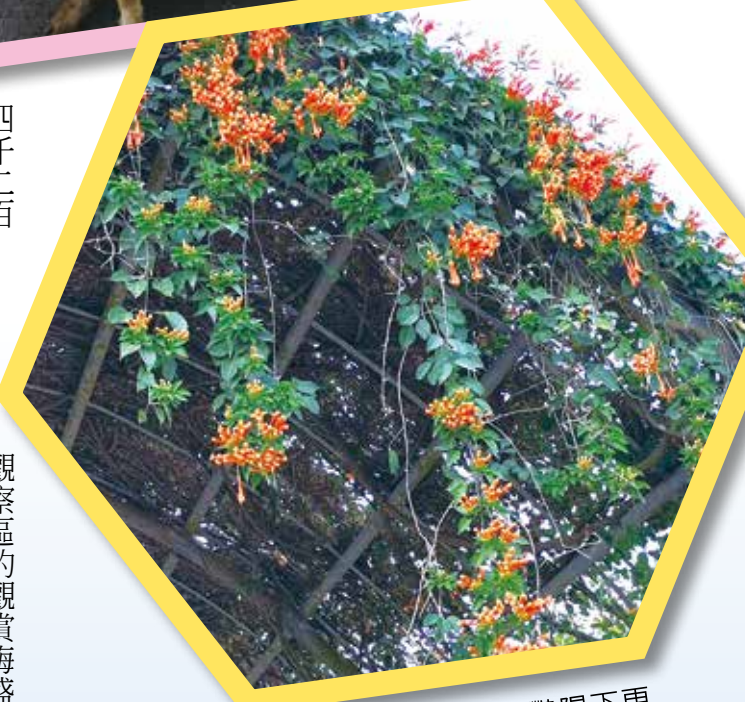
↑高雄農場炮仗花在豔陽下更顯得明亮耀眼。