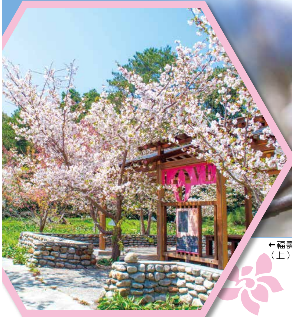
←福壽山農場可賞古野櫻(左)與鴛鴦梅(上)。