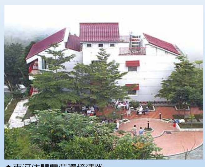
↑東河休閒農莊環境清幽。

【本刊訊】豬年到！春節團圓之際，別忘記全家到戶外走走，讓親情更加濃郁，也為年後的自己充飽繼續打拚的能量。輔導會所屬武陵、福壽山、清境、高雄及臺東農場各端出不可不看的花海、美麗景致和有趣活動，現在就安排行程，和最愛的家人「農場走春趣」。 武陵櫻花季 滿滿的幸福大平臺 武陵農場櫻花季幾乎已成為每年春節必遊景點的代名詞，為紓解上山賞櫻的人潮，場方今(一〇八)年仍依循往例，與公路總局共同規劃「場內總量管制、道路交通管制、團客預約入場及公共運輸接駁」四大疏運措施，上山賞花前請務必再三確認。 場方表示，武陵農場櫻花季於二月七日(農曆年初三)起登場，疏運措施也從二月七日起至三月十七日共二十一天，場內總量管制每日進場人數六千人，其中住宿遊客一千八百人，一日遊客限