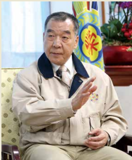
↑主任委員接受青年日報專訪，暢談輔導會服務照顧退役袍澤的成果與未來藍圖。

青年日報並在專訪中，以「成效斐然」及「推向新里程碑」，肯定輔導會積極擊劃、擴大並持續精進榮民與退役官兵服務照顧工作的成果。 促進穩定就業 創造雙贏局面 主任委員在專訪中表示，輔導會初期的重點工作是就業，但隨著環境變遷，後續再增加就學、就醫、就醫等項目，為退役袍澤提供更多、更周延的輔導及服務照顧面向。 在就業方面，主任委員表示，為增加官兵就業管道，並因應軍人退撫新制需求，輔導會放寬服務範圍，將服役四年以上、未滿十年的退役官兵，列為第二類退除役官兵，並透過穩定就業津貼、創業貸款利息補貼及職業訓練補助等資金管道，與就業適性評量、職業諮詢、職業講座、就業媒合、創業輔導等項目，協助官兵離開軍中後，順利銜接職場。