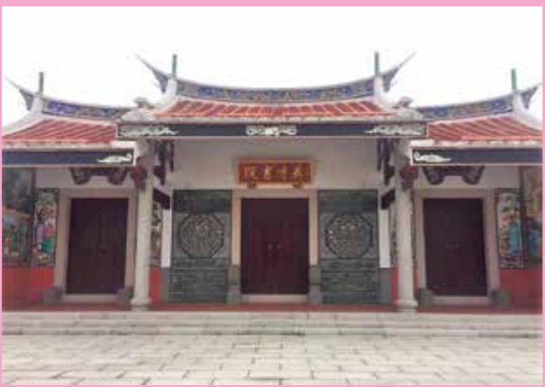
↑英才書院建築物典雅富麗。