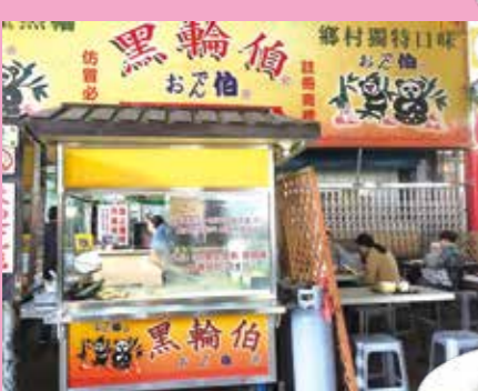
↑「粉粿」豆花一碗50元，可選5種配料。