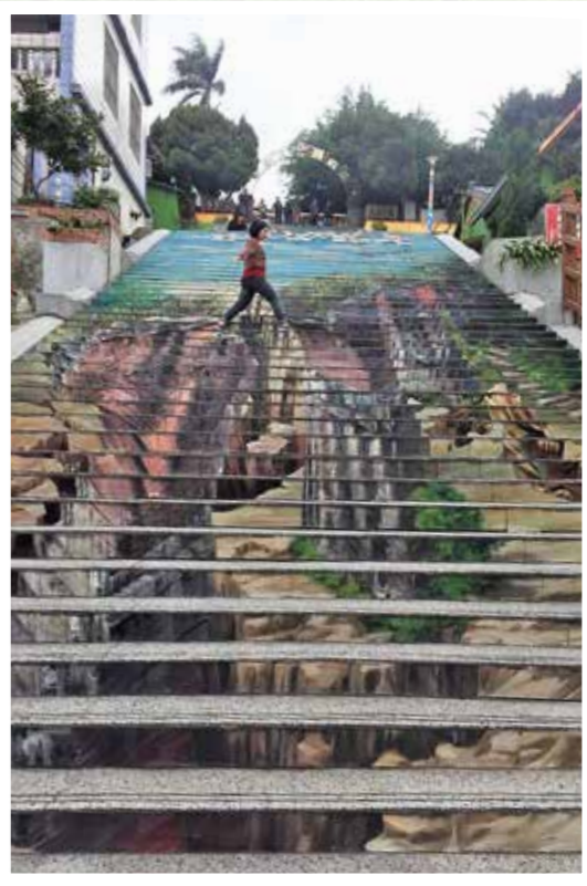
→建中國小旁的彩繪樓梯很吸睛。

服務 家歡迎符合 (眷)、遺 眾申請入住 榮家 市板橋區 段 32 號 22755157 榮家 市三峽區 127 號 26731201 榮家 市八德區 1217 號 3681140 榮家 市八德區 1100 號 3651285 榮家 市板橋區 41 號 5213292 榮家 市桃源里 段 301 號 7222187 榮家 系田中鎮 段 421 號 8747647 榮家 系斗六市 160 號 5324100 榮家 市白河區 草 63 號 6852164 榮家 市七股區 147 號 7880664 榮家 明路 190 號 2690418 榮家 市楠梓區 631 號 3652828 榮家 市燕巢區 路 1 號 6161214 榮家 系內埔鄉 100 號 7701621 榮家 市前路 29 號 8223111 榮家 市更生路 0 號 9222417 福田 人樂民榮春 自贈專戶 才團法人榮 基金會 行： 庫銀行 南路分行 次帳號： 626-734 局： 劃撥帳號 2111