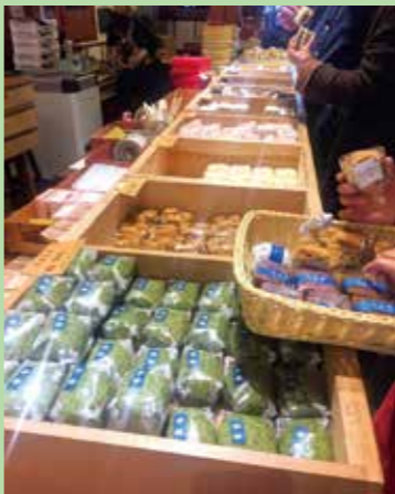
↑九鼎軒的米食種類多樣，包含艾草板、紅豆板等，很適合送禮。