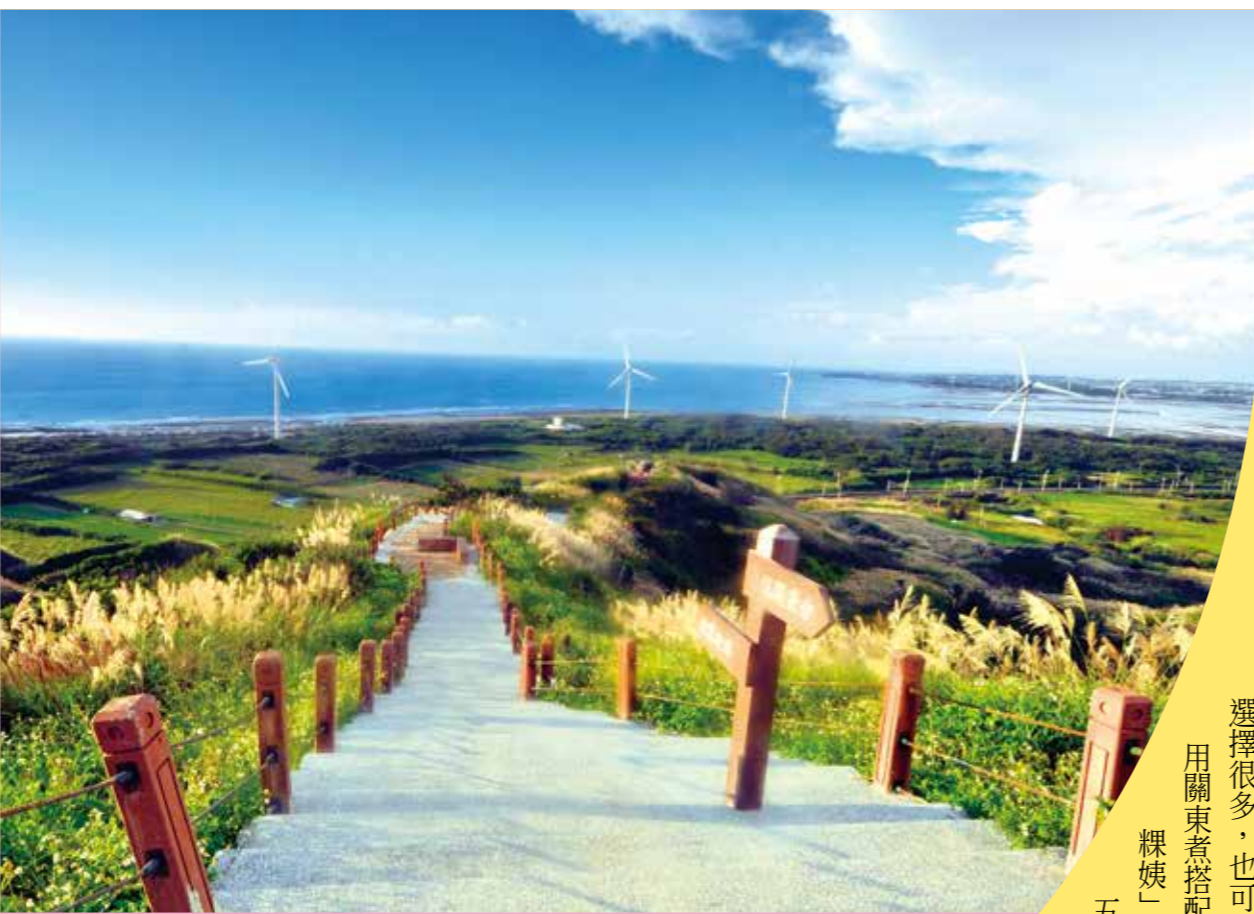
↑後龍好望角有一望無際的海景。

是特色民宿，各有不同體驗。出門旅遊當然不能忘了伴手禮，遊苗栗必買的伴手禮絕對是客家各類米食。位於三義的「九鼎軒」是苗栗有名的米食伴手禮店，外觀古色古香，米食種類很多，包含艾草板、紅豆板、黑糖米糕、麻糬、客家米粽等，也販售茶葉、精油及木雕產品。