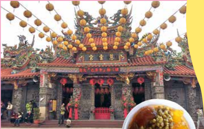
↑慈雲宮是當地信仰中心。