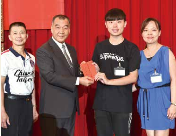
↑主任委員（左2）頒贈榮民子女就學補助，勉勵學子效法並傳承榮民報效社會國家的精神，為國家創造更美好的未來。

想。 主任委員表示，他很高興出席「榮民子女就學補助頒贈典禮」，因為能將榮民長輩幫助年輕榮民子弟奮發向學的心意，親自轉交給在場年輕同學們，傳承榮民大愛精神，非常有意義。 典禮一開始，先播放輔導會拍攝、記錄榮民捐款的微電影「奉獻」及「大愛如風」，榮民伯伯在影片中說：「救濟貧苦的榮民榮眷，還有一些子弟要讀書，各方面都要用錢。」讓在場的一百六十六位北部地區學生代表們感動不已。 主任委員表示，兩部微電