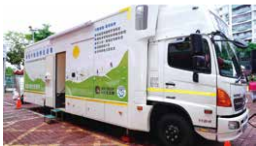
↑高榮與日月光打造的「智能行動醫療巡迴車」上路。