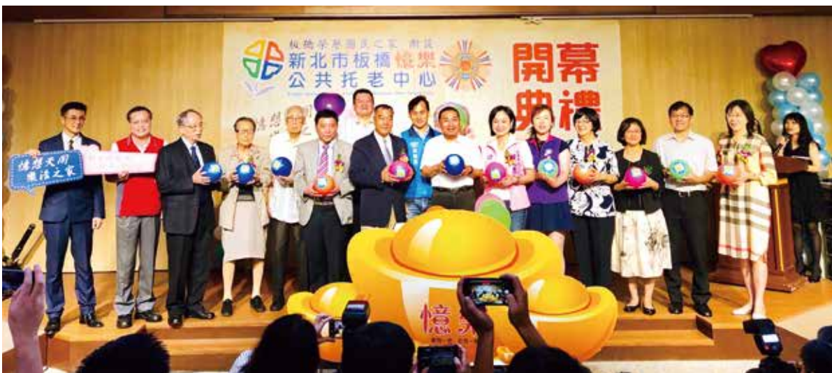
↑主任委員(左7)主持板橋榮家附設憶樂公共托老中心開幕典禮。

在地的立法委員柯志恩、新北市長侯友宜及新北市的民意代表等也出席開幕典禮，還有二位高齡九十幾歲的長輩鮑奎、朱佩琪等人共同揭幕。侯友宜在典禮中為新設立的五十五萬餘位長輩請命，希望進一步與輔導會「並肩作戰」，在位於三峽白雞的臺北榮家也增設社區型日照中心，以加強新北市的長照能量，獲主任委員當場允諾。 主任委員表示，板橋榮家投入社區式長照服務行列，不計照顧對象，更照顧到社區長輩，翻轉榮家既有服務模式，期許透過擴大資源共享，照顧更多的長輩。侯友宜也肯定表示，中心導入科技化人性服務，