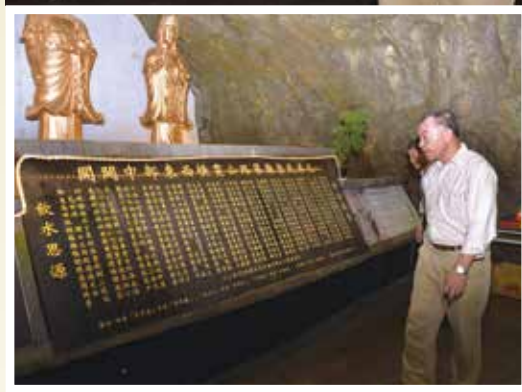
↑主任委員（前）向參與中部東西橫貫公路工程殉職的榮民英靈上香致敬。

【本刊訊】中部東西橫貫公路完工通車近一甲子，為感念當年因參與開路工程而殉職的榮民英雄，輔導會主任委員邱國正日前親至太魯閣國家公園長春祠主持「紀念開闢東西橫貫公路殞命榮民及築路人祭祀典禮」，向榮民英靈致祭與致敬。