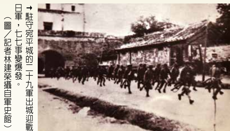
→駐守宛平城的二十九軍出城迎戰日軍，七七事變爆發。（圖／記者林建榮攝自軍史館）

【本刊訊】七月七日，是可歌可泣的日子。民國二十六年七月七日，在大陸河北省發生盧溝橋事變，揭開國軍浴血抗戰的序幕；民國四十五年七月七日，中部東西橫貫公路開工，蔣總統經國先生帶領一萬多位榮民弟兄，展開艱苦的開路工程。國軍與榮民基於「在營為良兵，在鄉為良民」的精神，化不可能為可能，在這天為國家付出、壯烈犧牲，才有今日臺灣的富足與和平，是國人不能遺忘的歷史上重要一頁。 七七事變 抗戰序幕 日本自明治維新後，積極對外擴張，朝鮮、中國為其主要侵略目標。隨著發動「九一八事變」、逼我國簽訂「塘沽停戰協定」、誘內蒙古獨立，日本野心，昭然若揭。而「西安事變」後，國共停止內戰，一致抗日成舉國共識。 民國二十六年一月起，日本變本加厲，七月七日晚上十時，在盧溝橋附近演習完畢，聲言有士兵失蹤，須進入宛平城搜索，並開槍示威。我方允代為查尋，然無蹤跡。逾時日軍調士兵已歸隊，雙方赴宛平調查。隔天，日軍包圍並砲擊宛平城，我方英勇反擊。 七七事變爆發後，國內禦侮之聲蜂起，國民政府難再姑息，遂演變為中日兩國的全面戰爭。民國二十六年七月三十一日，蔣中正發表「告抗戰全體將士書」，宣示抗戰到底，體將士書，宣示抗戰到底，舉國一致，不惜犧牲，以驅逐倭寇，復興民族。在全國軍民上下一心、共赴國難之下，獲得八年抗戰最終勝利，並收復臺灣等島嶼。 參與中橫工程榮民僅能以簡單工具，徒手開路。 （圖／輔導會）