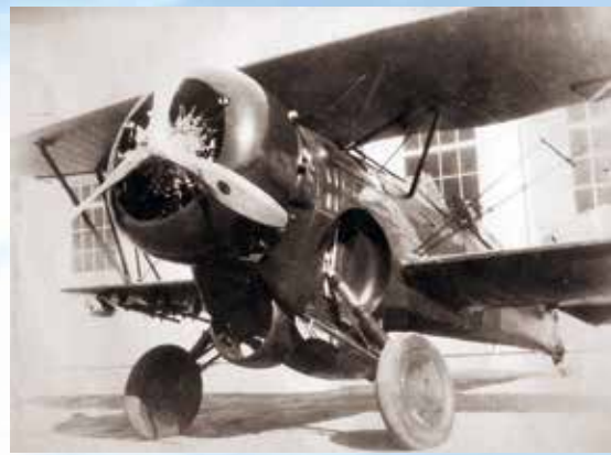
↑ 814空戰大捷我軍之「霍克三型」飛機。

民國二十六年七月七日，日本與兵盧溝橋，八月十三日復於上海發動淞滬會戰，翌日我空軍參戰，發揮「我死則國生」的戰鬥精神，於寶橋與廣德空域，以劣勢裝備首挫敵機，獲得輝煌戰果。國民政府為紀念抗戰首次空戰勝利，於二十八年九月，正式下令每年八月十四日為「空軍節」，除緬懷空軍保家衛國、無懼犧牲之情操，並激勵後進效法先烈先賢精神。