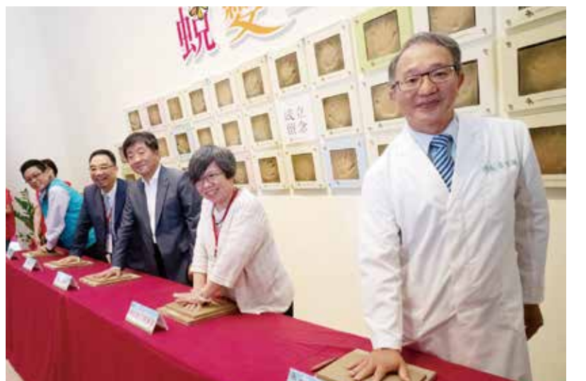
↑衛福部部長陳時中(右3)肯定「蛻變驛園」成果並拓手印留念。右1為院長李世強。

【本刊訊】嘉義縣政府設置全國第一座女性藥癮者安置機構「蛻變驛園」，一〇七年起委由臺中榮總嘉義分院承接至今，協助許多女性藥癮更生人重返社會，順利「蛻變」。衛生福利部部長陳時中日前率全國各縣市衛、社政首長前往觀摩，對中榮嘉義分院的努力與成果表示讚賞與肯定。 嘉義縣政府為使女性藥癮者有良好的安置環境接受後續治療，民國一〇五年整合公部門與民間資源設立「蛻變驛園」，一〇七年起委由中榮嘉義分院承接。中榮嘉義分院透過專業醫療團隊，評估女性藥癮者個別的需求，進而規劃、治療與生活輔導、職訓重建等方向，藉由網絡合作，迄今已協助許多女性藥癮更生人回歸社會，有效提升了女性藥癮者無虞的生活環境。 在戒癮治療與復發、預防的成效。 陳時中、嘉義縣衛生局局長祝年豐、社會局局長李政毅及全國各縣市衛、社政首長，日前在中榮嘉義分院院長李世強陪同下參訪「蛻變驛園」。園區內採溫馨的家庭氛圍設計，親子房設置名為「灶咖」的烹飪、烘焙區域，鼓勵住民到市場採購食材，增加與社會外界接觸和互動的機會。 園區另設名為「呷飯廳」、「交誼廳」的區域，提供住民一同用餐的空間，建立歸屬感；園區內亦有生活輔導員二十四小時協助女性藥癮者生活適應及協助，給予住民安全無虞的生活環境。