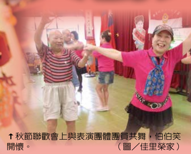
↑秋節聯歡會上與表演團體團員共舞，伯伯笑開懷。

→主任委員在板橋榮家祈福卡上寫著「照福榮民」期許，署名「大鵬」。