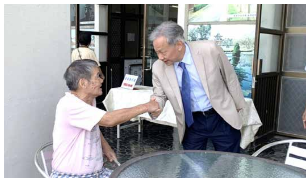
↑呂副主任委員（右）特別於研習會的茶敘休息時間，問候榮家住民長輩，長輩也熱情回應。

驗所主任秘書林俊成也到場。茶會中播放「風華再現」影片，回顧森保處六十年的發展，其中斑駁的黑白照片都是大時代下一道道動人的風景，讓退休前輩們及在場人士感動不已。 森保處處長鄭仰生表示，榮民前輩早年在山林中從事林業經營的勤奮與艱辛，化為森保處今日的豐碩成果，令人感佩與感謝，冀望森保處全體同仁在前人奠定的基礎上發揚光大，精益求精，朝永續經營的願景持續邁進。 茶會中也致贈取材自樓閣山林區栽種的紅檜造林木，所製成的匾額，給歷年來對森保處貢獻卓著的單位及人員，謝謝他們的投入與協助。