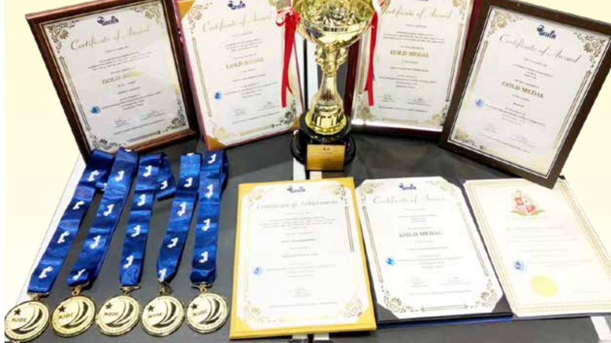
↑ 高雄榮總醫療團隊於高雄國際發明展上滿載而歸。

【本刊訊】高雄榮總研創中心、重症醫學部、藥學部、護理部、核子醫學科、健檢中心參加二〇一九高雄國際發明展，勇奪大滿貫五金牌及大會特別獎，新加坡發明協會頒發新加坡發明協會大會特別獎。 由高榮健康管理中心與研創中心共同研發「防壓傷一次性咬牙膠套」，以兒童奶嘴創新思維進行開發，開口孔洞處以硬式軟式軟式材質為主，方便醫師操作時，兼顧病人的舒適度及安全性，提供病人柔軟及合應口腔的包覆，防止病人上下唇壓瘡及損傷，獲二〇一九高雄KIDE國際發明暨設計展金獎及大會特別獎。 高榮團隊結合內外科、急診醫學部品管中心、資訊室、護理部及重症醫學部跨部門合作，創新發明「早期警示系統」專利，這是高榮利用大數據與串流統計方法，進行重症病人嚴重度評估的臨床決策輔助工具，結合病房數位白板，目前已廣泛應用於高榮臨床場域，成為醫師時刻查房的最佳輔佐工具，曾獲得國家醫療品質獎。