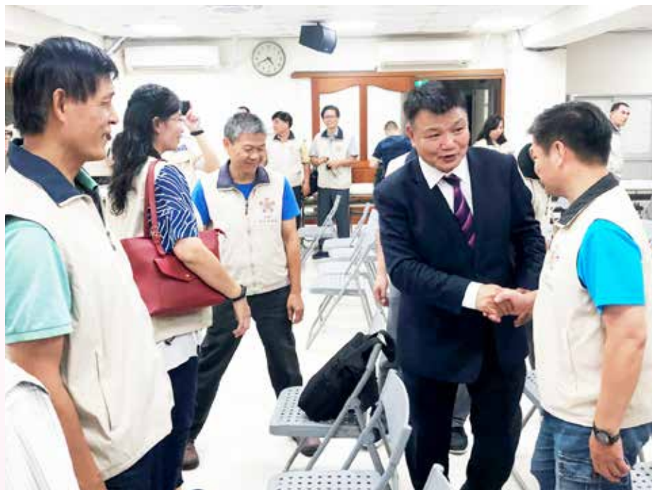
↑ 李副主任委員鼓勵同仁有問題就提出來討論、想辦法改善。

【本刊訊】臺北榮總新竹分院為妥善照顧偏鄉居民的健康，避免流行性感冒症，於一〇八年一月率先引進新穎的流感病毒快速檢測分子檢驗技術，可於十五分鐘內提供快速且精準的流感病毒檢測結果。 快速流感病毒分子檢測較傳統檢驗法具有下列優點：一、降低病人因採集檢體的不適感；二、提高陽性檢出率；三、降低人為誤差；四、降低群聚感染風險等。因此，除了可提供門、急診及住院患者更精確的檢驗效能外，更有助醫師於短時間內做出即時準確的治療決策，進而可避免院內傳染或社區群聚感染，降低流感併發重症甚至導致死亡的發生病例。 北榮新竹分院於今年一月起啟用新穎的快速流感病毒分子檢測技術，於今年一至七月共收治類流感症狀病例計一千七百八十五位，其中初步篩檢為流感陽性的病例有三百例，陽性率為二十一·四%，其中以A型流感病毒為主，占了所有陽性率的七十九·九%。上述以快速分子檢測法進行檢測者計一千二百七十三例，陽性率為十五·六%，以傳統檢測法檢驗者計五百一十一例，陽性率為六·八%，顯示快速分子檢測法有較高的陽性檢出率。