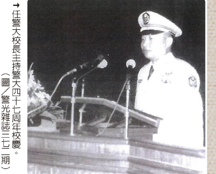
↑任警大校長主持警大四十七周年校慶。（圖／警光雜誌三七期）