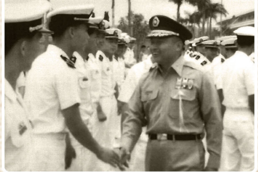
↑任預校校長（中）慰勉中一期海軍同學。