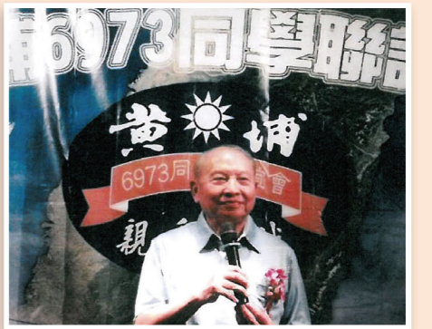
↑周前主任委員出席黃埔校友聯誼會。