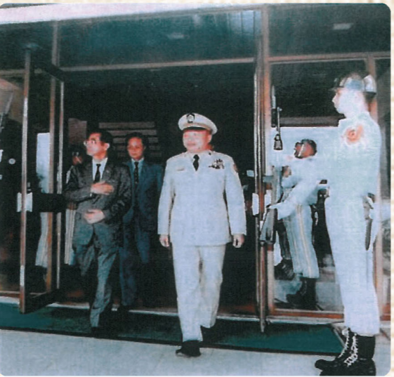
↑任警大校長時（中）玉照。