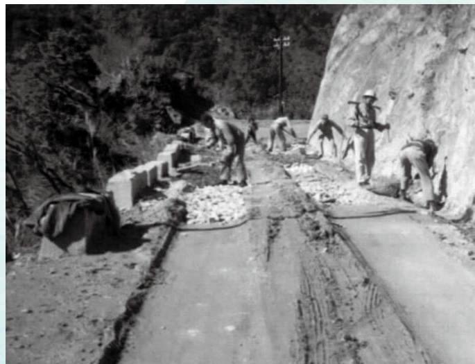
↑民國56年台8線施工中。