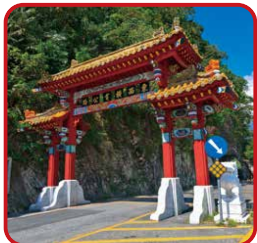
↑東西橫貫公路入口牌樓。