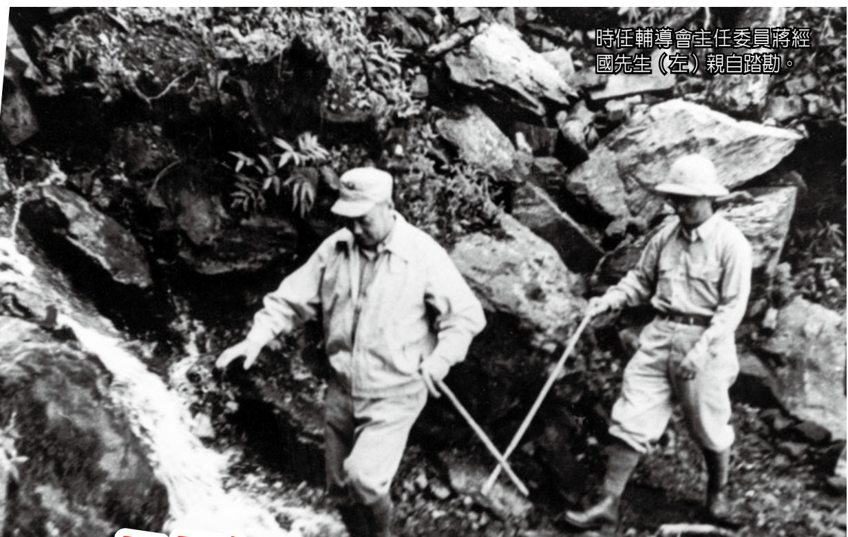
時任輔導會主任委員蔣經國先生（左）親自踏勘。