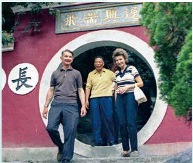
↑時任國防部長蔣經國先生與外賓於長春祠合影。