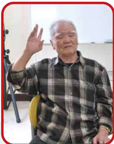
↑梅定爺述說著當年如何在中橫公路上攀爬磐石。