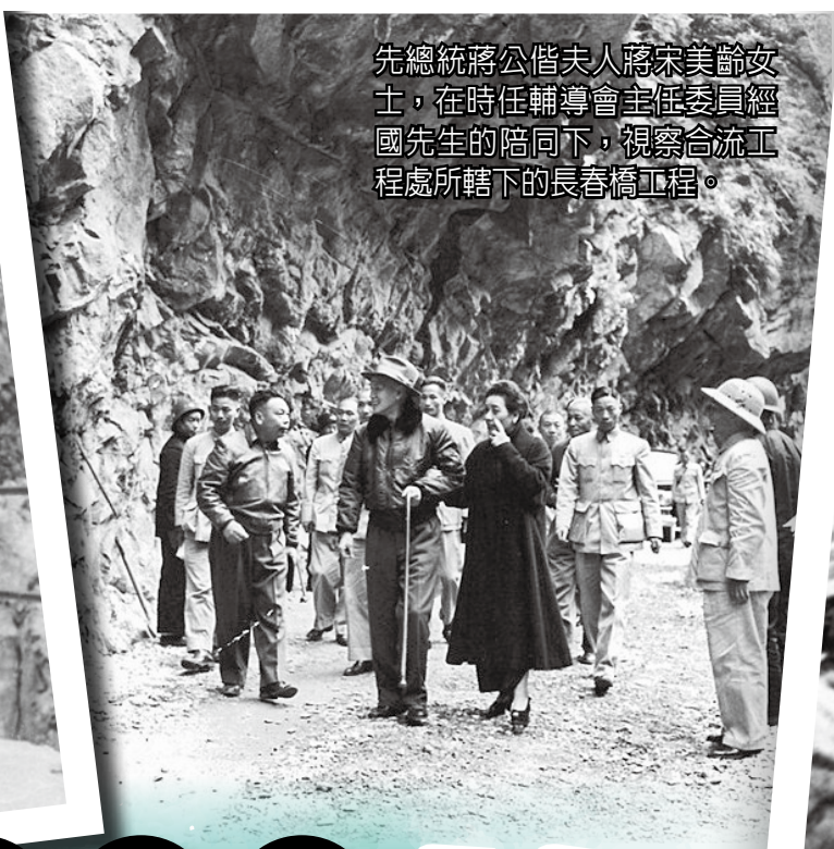
先總統蔣公偕夫人蔣宋美齡女士，在時任輔導會主任委員經國先生的陪同下，視察合流工程處轄下的長春橋工程。