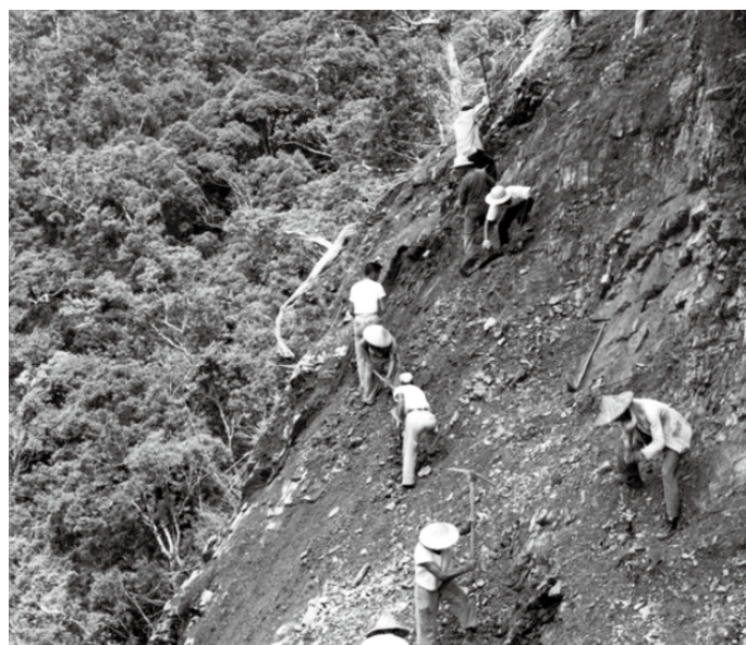
↑因無法使用大型機具，僅能以人工開闢道路。

不畏苦不怕難 成就驕傲榮光 中橫公路興築艱難之處為沒有辦法使用大型機具，工程人員須用雙手敲石鑿壁，一吋一吋的打通公路，且從開工到通車只用了三年十個月。回首中橫公路興築過程，現